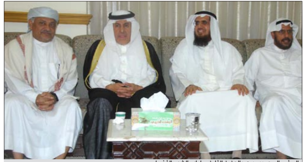
السفير السعودي د.عبدالعزیز الفايز بيارك بالشهر الفضيل