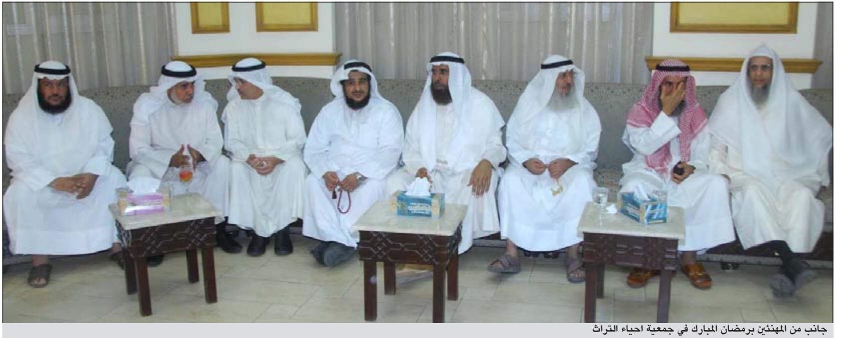
جانب من المهنيين برضمان المبارك في جمعية إحياء التراث

تنفيذ «ولائم الإفطار» في 24 دولة بتكلفة 81625 ديناراً