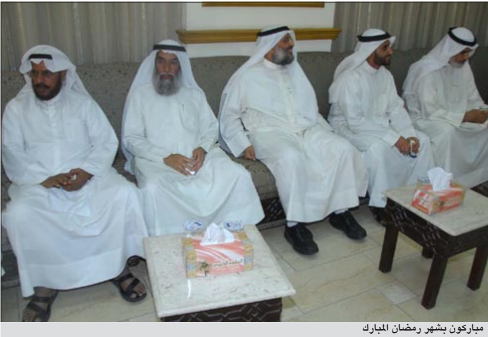
مباركون بشهر رمضان المبارك