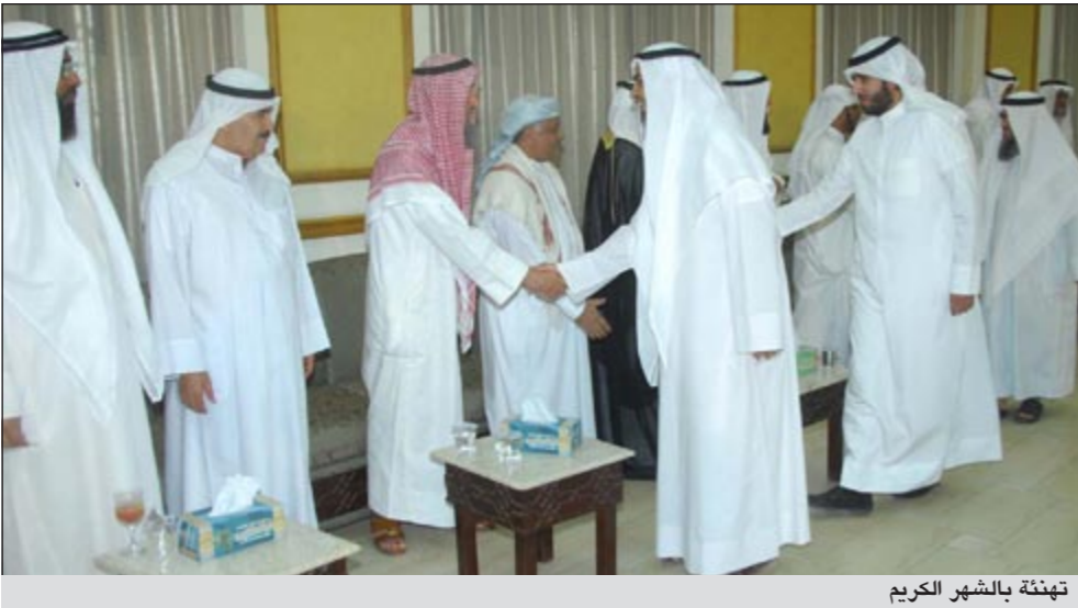
تهنئة بالشهر الكريم