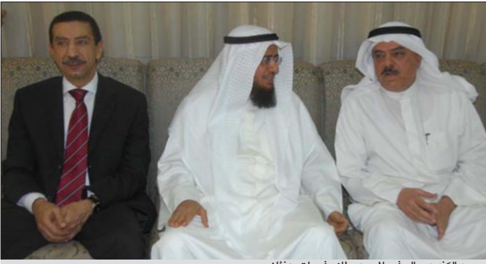
محمد الكندري والسفير المصري طاهر فرحات يهتنان