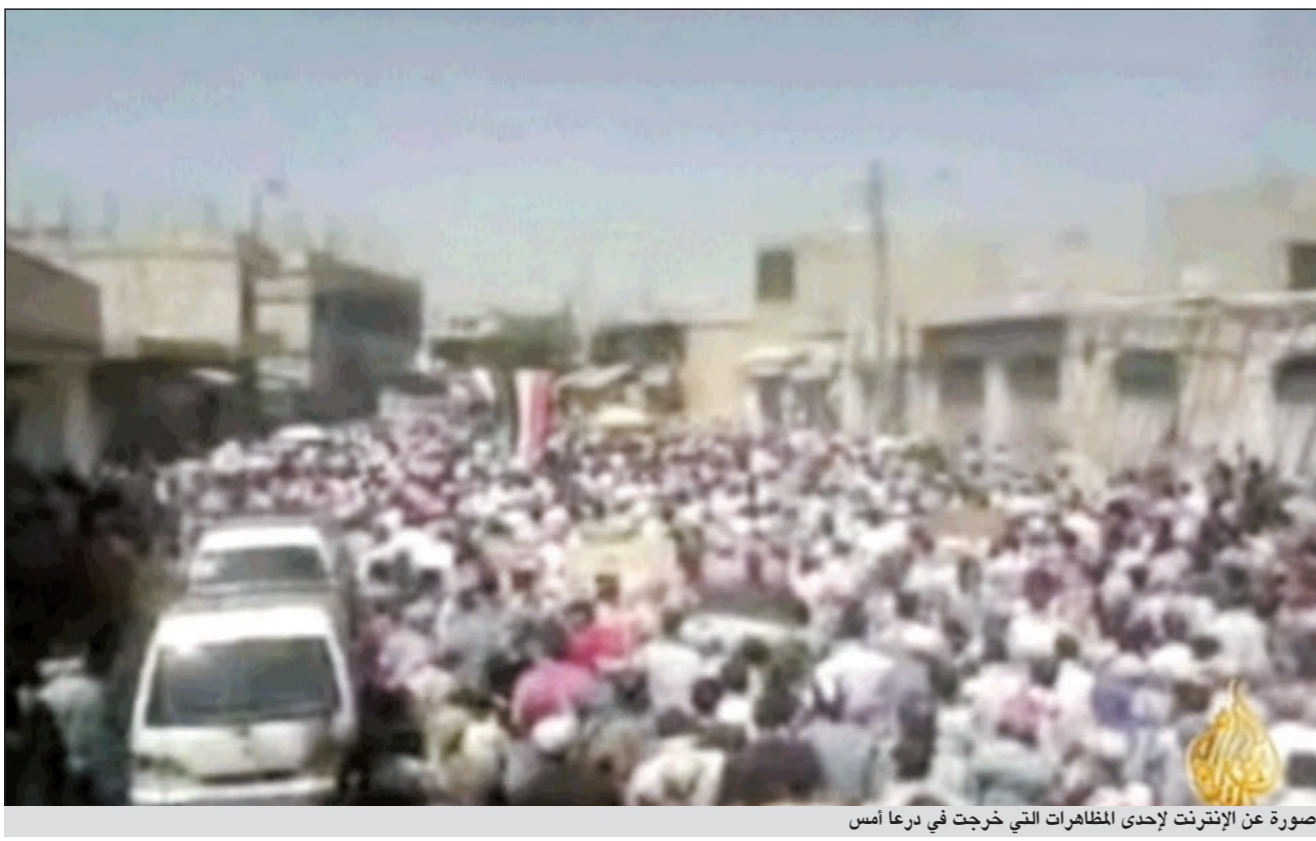
صورة عن الإنترنت لإحدى المظاهرات التي خرجت في درعا أمس

التي يقودها الجيش السوري وقوات الأمن في مدينة حماة أمس والتي أغلقت المدينة تماما وعزلتها عن العالم، متزامنة مع خروج مظاهرات في عدد كبير من المدن. ووسط معلومات عن أن صلاة الجمعة لم تقم في حماة بسبب عمليات القصف والقنص التي منعت الناس من التوجه إلى المساجد، أسفرت المظاهرات التي أطلق عليها نشطاء المعارضة الجمعة «الله معنا» عن سقوط حوالي 10 قتلى واضعافهم من الجرحى في أنحاء مختلفة من سورية أغلبهم في عربين بريف دمشق. وقد امتدت المظاهرات من القامشلي إلى دير الزور مروراً بحمص وادلب وبعض أحياء حلب إضافة إلى درعا وريفها. على صعيد المواقف الدولية، وبعد تحذير الرئيس الروسي ديمتري ميدفيديف لنظيره السوري بشار الأسد من «مصير محزن ينتظره وستضطر في