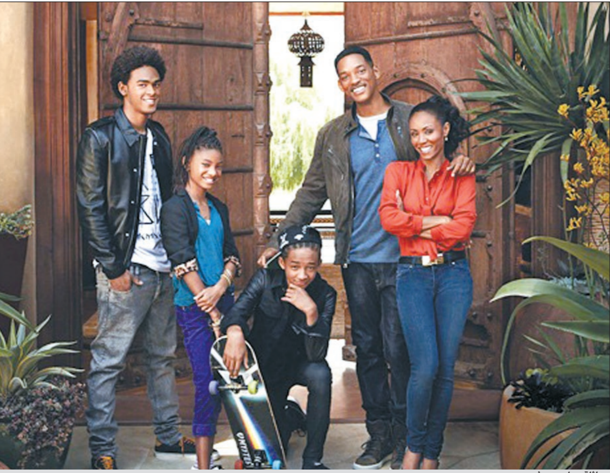
عائلة ويل سميث