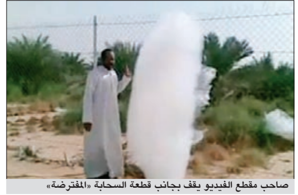
صاحب مقطع الفيديو يقف بجانب قطعة السحابة «المفترضة»

وكالات: أثار مقطع فيديو نشر على موقع اليوتيوب دهشة متابعيه، بعدما وثقت من خلاله حادثة سقوط سحابة على الأرض في منطقة برع فارس في دولة الإمارات العربية، حسب حديث الشخص الذي صور المقطع. ويظهر المقطع الذي نشر قبل أيام قليلة على اليوتيوب، سحابة صغيرة تنهال من السماء إلى أن تسقط على الأرض، ومن ثم تشتت في سياج حديدي قسمها إلى أجزاء. مصور مقطع الفيديو الذي رصد الحدث توقف بسيارته جوار السحابة، وطلب من أحد العمالة مواصلة تصويره بالجوال جوار السحابة، حيث أتجه للسحابة وبدأ بملامستها بده. ورد الشخص الذي صور الفيديو ذكر الله والتسبيح، وأن ما حدث عبارة عن واحدة من معجزات القدرة الإلهية، كما أبدى تعجبه، وقال ربما لا أحد يصدق أن هذه سحابة، مشيراً إلى أن ما رآه ووثقه بالفيديو يعد من المعجائب.