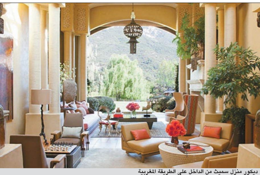
ديكور منزل سميث من الداخل على الطريقة المغربية

الف قدم مربعة. وصمم منزل آل سميث مهندس الديكور ستيفن سامويلسون الذي استخدم العديد من المحتويات اليدوية الخشبية لإعطاء الطابع الحميم والخاص بأصحاب المنزل. وتضمن المنزل أيضا ديكورات مستوحاة من التراث الفارسي