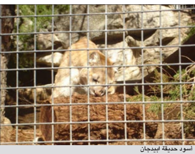
أسود حديقة أيبيدجان

كما أظهر الاستطلاع أيضا أن 48٪ من المسلمين في أميركا أقروا بأنهم تعرضوا لتجارب التمييز العنصري أو الديني وأنهم يتعرضون للتمييز بدرجة كبيرة لصالح البروتستانت، والكاثوليك واليهود والموارنة والمحددين.