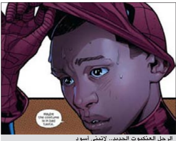
الرجل العنكبوت الجديد.. لاتيني أسود

نيويورك - يو.بي.أي: تحول الرجل العنكبوت من شاب أميركي أبيض إلى شاب يخلط بين العرقين الأسود واللاتيني في العدد الجديد من المجلة المحصورة الذي تصدره دار نشر «مارفل كومكس».