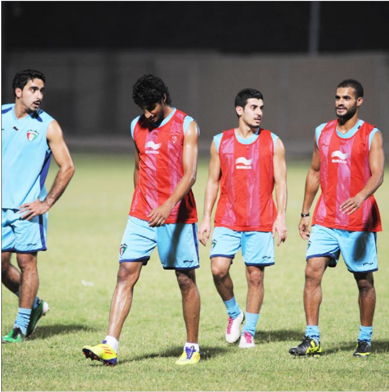
الطوع ونذا الموسوي خارجون من التدريب

أدى الأزرق مساء أمس الأول تدريبه الأول على ملعب المرحوم عبدالرحمن البكر في اتحاد الكرة، وذلك قبل لقاء كوريا الشمالية الأربعة المقليل ودياً على استاد الصداقة والسلام بنادي كاملة ضمن إعداد الأزرق لخوض الدور الثالث من تصفيات كأس العالم 2014 بالبرازيل، حيث سيفتتح لقاءه أمام المنتخب الإماراتي يوم 20 سبتمبر المقبل في أبوظبي.