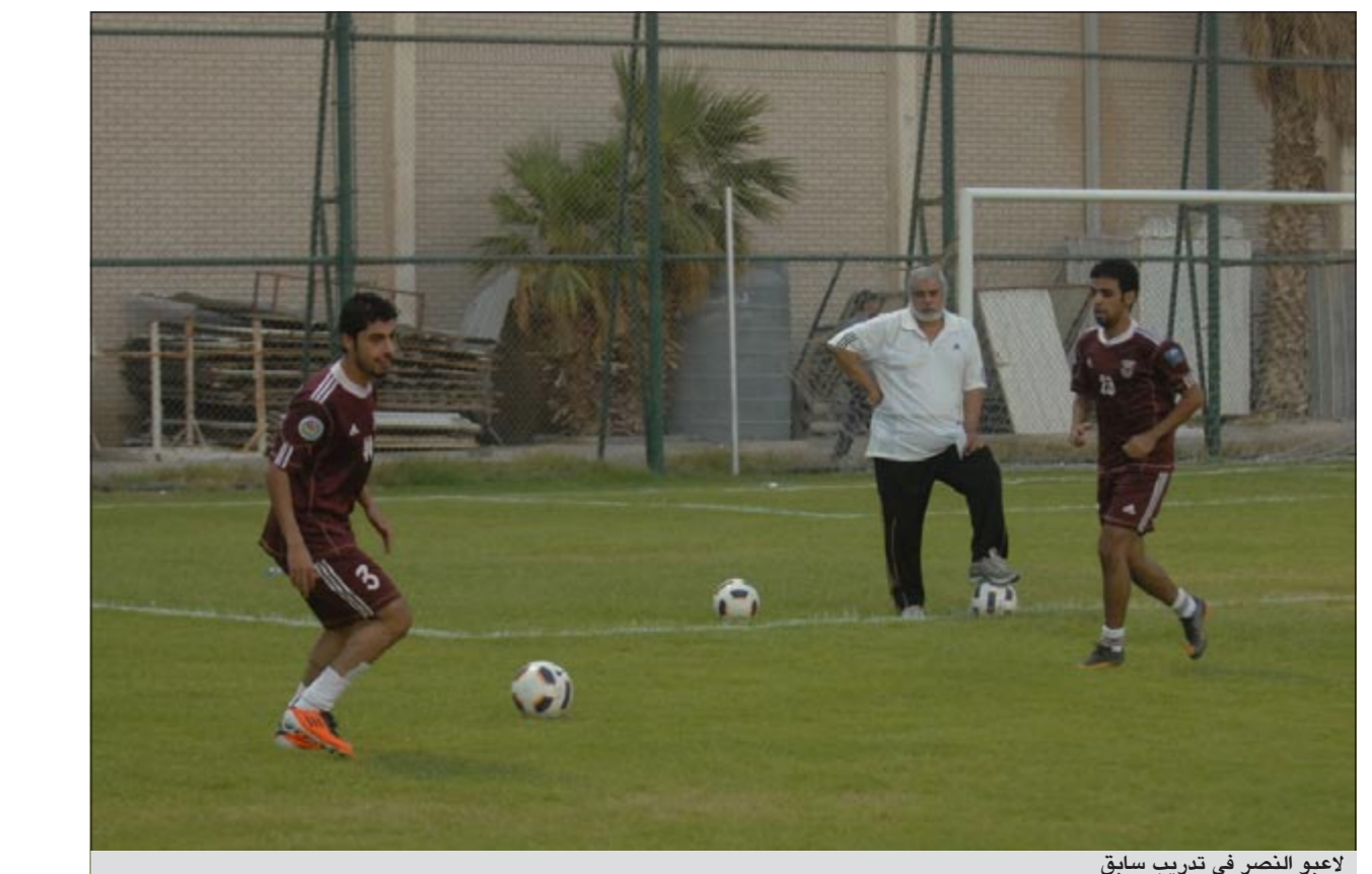
لاعبو النصر في تدريب سابق

المعرب وادو عن سعاداته لأنه كان جزءاً من فريق متميز في حجم لخويا الذي شارك زملاءه لحظات رائعة، متمنياً أن يواصل هذا الفريق مسيرة النجاح في الموسم الجديد.