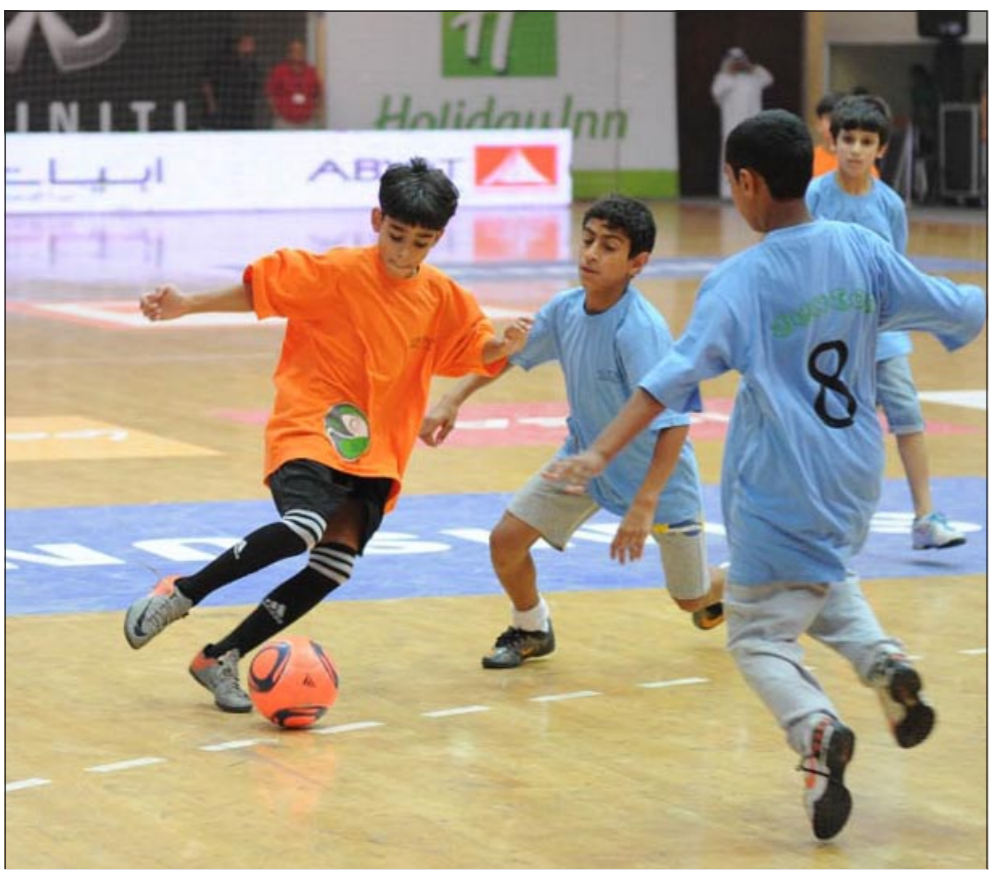
بطولة البراعم تشهد إثارة كبيرة

أكد الإيراني شمس الدين المدرب السابق للمنتخبين الإيراني والأزرق لكرة الصالات أن دورة الروضان تتحسن من عام لآخر لما تقدمه من مستويات فنية راقية ولاعبين رائعين سواء المحليون أو المحترقون وهو ما يسهم بشكل كبير في تطور مستوى اللعبة بالكويت. ويرى شمس الدين ان الروضان أصبحت ككاس عالم مصغرة أو بطولة موازية لبطولة العالم مؤكدا انها لا تعتمد فقط على اللاعبين المحليين ولكنها