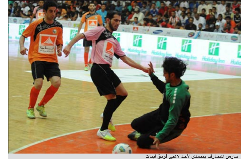
حارس المصارف يتصدى لأحد لاعبي فريق ابيات