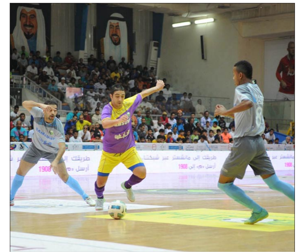
صراع على الكرة