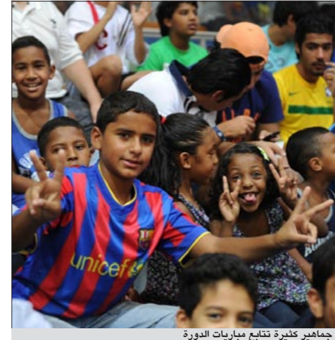
جماهير كثيرة تتابع مباريات الدورة