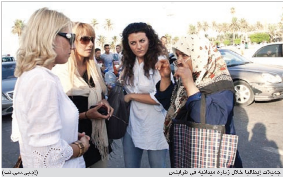
جميلات إيطاليا خلال زيارة ميدانية في طرابلس

عواصم - وكالات: قال سيف الإسلام نجل الزعيم الليبي معمر القذافي أن الحكومة تسعى للتحالف مع الإسلاميين الإصويين في المعارضة الليبية لإبعاد الليبراليين مرجحا التوصل الي اتفاق معهم خلال شهر رمضان، إلا أن مصادر اعتبرتها محاولة لشق صفوف المعارضة.