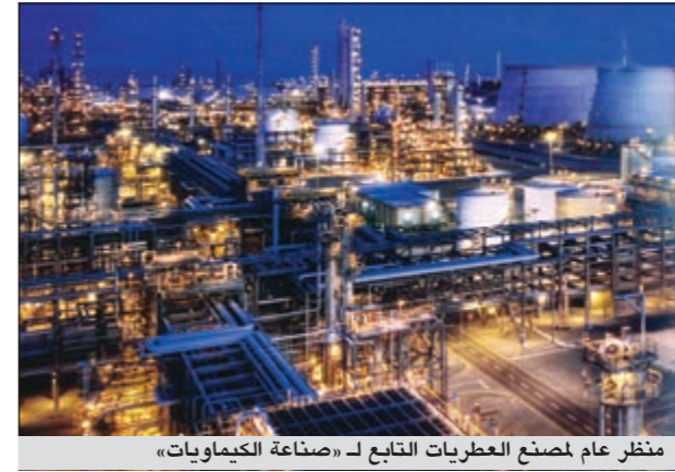
منظر عام لمصنع العطريات التابع لـ «صناعة الكيماويات»

مواد الوقود التنظيف». وقال المصدر إن مصنع العطريات الذي تم تشغيله رسمياً في 22 ديسمبر 2009 بقيمة مليار دولار، وهو تابع للشركة الكويتية لإنتاج البرازيلين التي تقوم «الكويت» بتشغيلها، ينتج مادتي البرازيلين والبنزين طبقاً لأفضل المعايير الصناعية في منطقة الشعبة الصناعية، مبيناً أن الطاقات الإنتاجية الحالية للمجمع تصل إلى 829 ألف طن متري سنوياً من مادة البرازيلين، و393 ألف طن متري سنوياً من مادة البنزين.