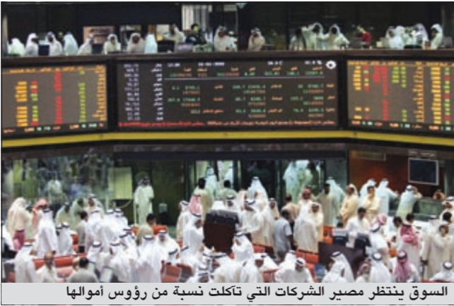
السوق ينتظر مصير الشركات التي تآكلت نسبة من رؤوس أموالها

وقال الشريهان إن السوق يعاني على وقع غياب المحفزات الإيجابية التي تدفع به إلى الارتفاع والتي على رأسها العمل على ضخ إنفاق رأسمالي عاجل في القطاعات