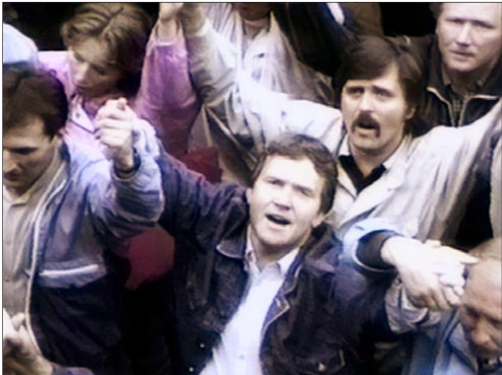
يدا بيد في التطلع إلى الحرية

في استونيا كانت البداية وبعد سلسلة من التجمعات بلغ أعضخها نحو 300 ألف (أكثر من ربع عدد سكان البلد) في حي مدينة القديم في العاصمة