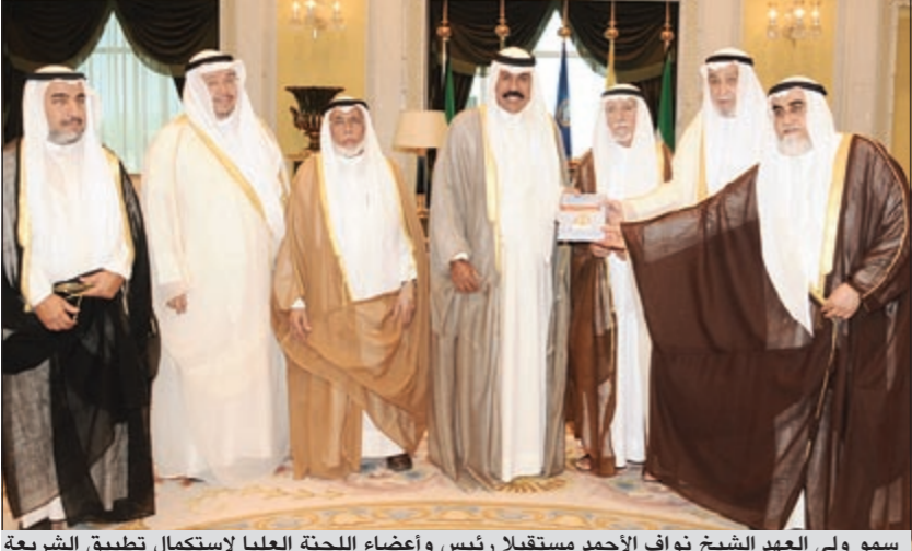
سمو ولي العهد الشيخ نواف الأحمد مستقبلاً رئيس وأعضاء اللجنة العليا لاستكمال تطبيق الشريعة

الأمتين العربية والإسلامية بالخير واليمن والبركات. وقد شكر صاحب السمو الملكي الأمير سلطان بن عبدالعزيز سمو ولي العهد على هذه المشاعر الأخوية الصادقة، داعياً المولى عز وجل أن يمتع سموه بالصحة والسعادة والسرور وطول العمر، وأن يعيد هذه الأيام على سموه وعلى الكويت وشعبها الوفي بمزيد من الرقي والرفعة تحت قيادة صاحب السمو الأمير الشيخ صباح الأحمد وعلى الأمة الإسلامية بالخير والبركة.