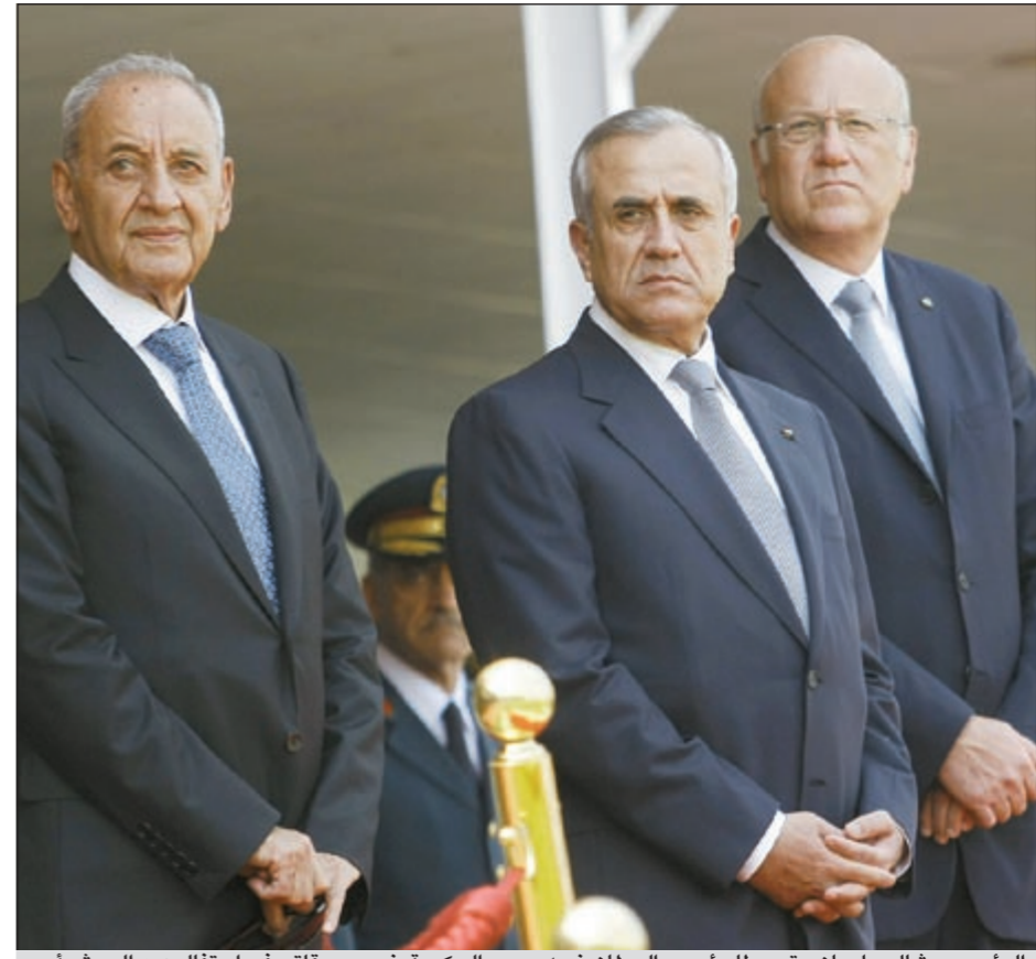
الرئيس ميشال سليمان متوسلاً رئيسي البرلمان نبيه بري والحكومة نجيب ميقاتي في احتفال عيد الجيش أمس

دعا رئيس الحكومة اللبنانية نجيب ميقاتي الجميع من دار الفتوى أمس إلى «التعاون لأرساء كلمة سواء تنقذ وطننا وتعزز وحدتنا» وشدد على «أن دار الفتوى هي للجميع، وستبقى دائما صاحبة الكلمة الأساس في كل المقاصل الوطنية». وامتى «على جميع القيادات اعتماد خطاب متوازن يهدئ النفوس ويرسي أرضية ملائمة للحوار وتحصين وطننا من الاخطار الداهمة وتكريس مناخات الثقة بين اللبنانيين جميعا بعيدا عن الاعتبارات السياسية والطائفية والمذهبية».