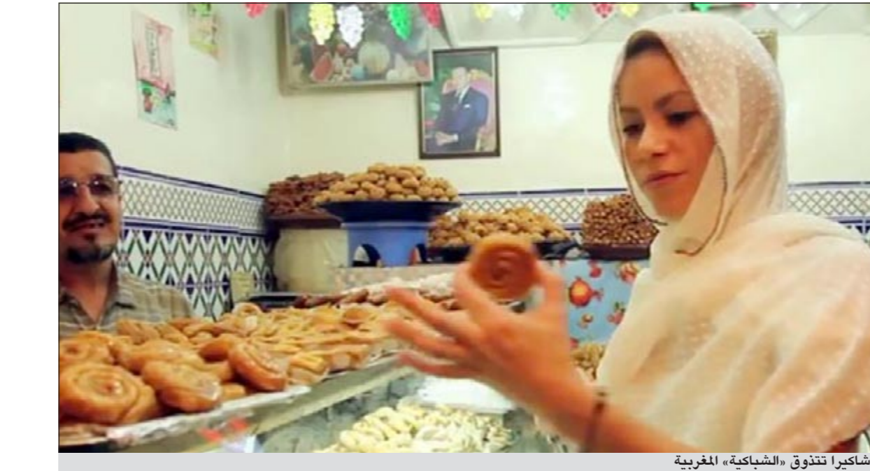
شاكيرا تتذوق «الشباكية» المغربية

الذي يردد فيه باقي أعضاء فرقته: «بارصا بارصا». ورافقت كاميرا الشريط الفنانة العالمية لحظة انتهاء برشلونة الإسباني. وفي ارتباط بفرقة «البارصا»، أرفقت الفنانة العالمية بالشرط مقاطع من السهرة الفنية التي أحيتها بمهرجان «موازين»، وظهرت قبل صعودها المسرح، وهي تتابع بتركيز اللقاء النهائي لكأس عصابة الأبطال الأوربية بين فريق «برشلونة» و«مانشستر يونايتد» الإنجليزي، في الوقت