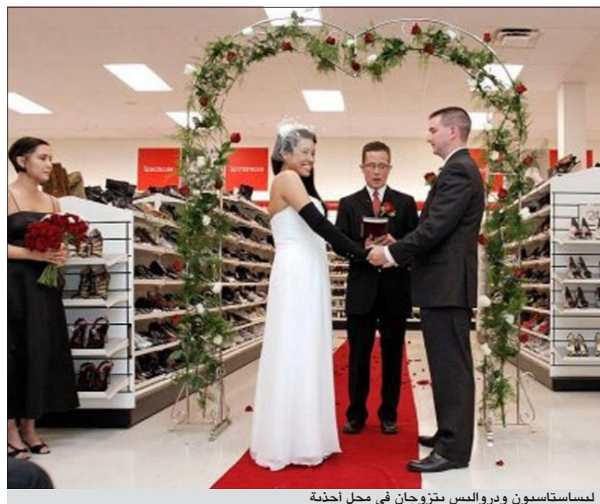
ليسانتاسيون ودرواليس يتزوجان في محل أحذية