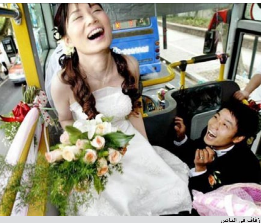
زفاف في الباص