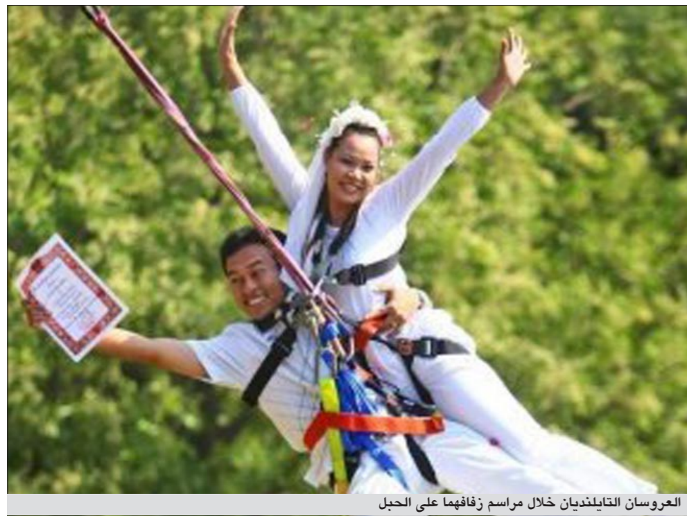
العروسان التايلنديان خلال مراسم زفافهما على الحبل

يشار إلى أن هذه هي المرة الثانية خلال عامين فقط التي يشهد فيها السوق نفسه مثل هذا الحريق، فيما فتحت الشرطة تحقيقا للوقوف على ملابسات الحادث.