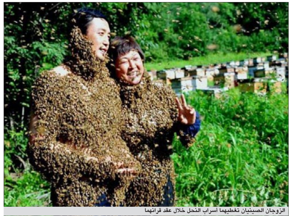
الزوجان الصينيان تغطيهما أسراب النحل خلال عقد قرانهما

أما 26 أميركيا وأميركية فقد قرروا أن تكون حفلة زفافهما مختلفة إذ قام الأزواج الـ 13 بالاحتفال جماعيا على عربة «قطار الموت» في احد ملاهي مدينة كليفلاند الأميركية، وذلك في فبراير 1999، أما الأطراف فعروسان صينيان قررا عقد قرانهما في باص مواصلات، خاصة بعد ان كان لقاؤهما الأول في حافلة للنقل العام وتم زفافهما في العام 2005، وقد شهدت ولاية نيويورك أخطر حفلات الزفاف عندما قرر عروسان أميركيان إقامة مراسم زفافهما في قفص محاط بأسمك القرش في مارينا المدينة في العام 2010.