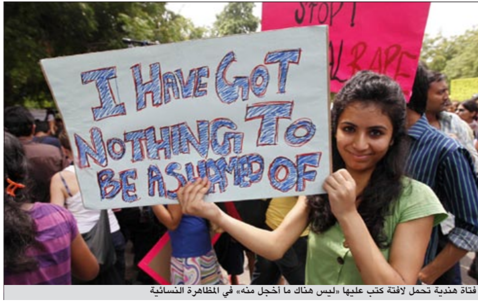
فتاة هندية تحمل لافتة كتب عليها «ليس هناك ما أخجل منه» في المظاهرة النسائية

ولماذا ترتدي هكذا؟» وتعود قصة هذه المسيرات النسائية التي امتدت من تورونتو بكندا إلى عدد من المدن الأوروبية عقب تصريح لأحد ضباط الشرطة بأن النساء يمكنهن تجنب التحرش الجنسي والاعتصاب بعدم التزيين والخروج مثل «الساقطات»، وهو ما أدى إلى اندلاع المسيرات الغاضبة احتجاجا على هذا التصريح لاثبات أن الملابس والزينة ليست هي السبب الرئيسي للتحرش الجنسي، وقد وجدت نساء الهند في هذه المسيرات مناسبة للإعلان عن رفضهن للاقاء اللوم دائما على الفتاة في حالة وقوع جريمة اغتصاب.