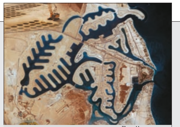
مسح جوي للمدينة

الجزء الثاني من تقرير «ديسكفري».. مدينة صباح الأحمد البحرية علامة بارزة في تاريخ الكويت المعاصر 28 29