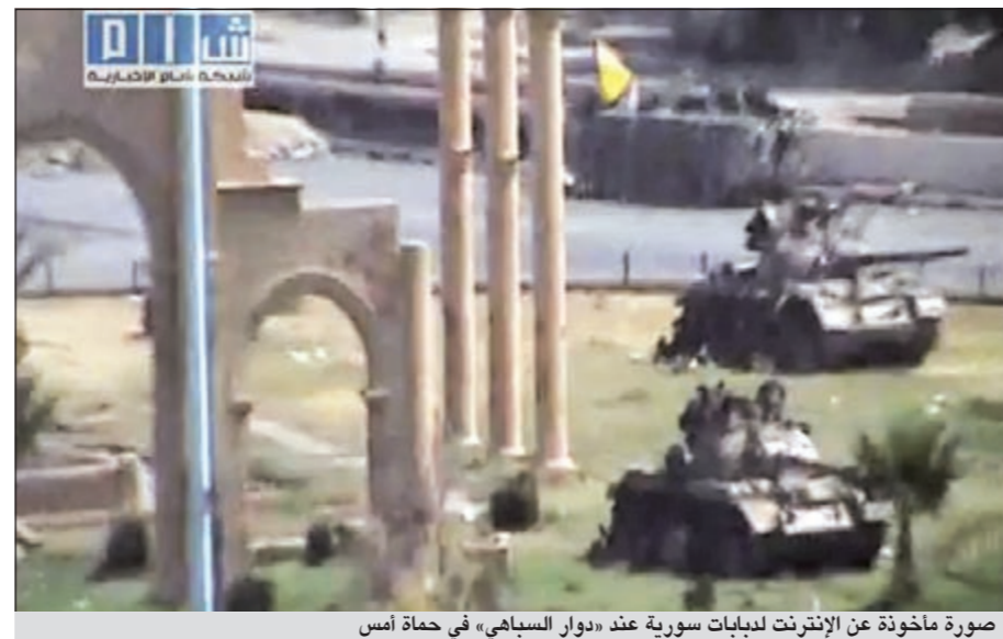
صورة مأخوذة عن الإنترنت لدبابات سورية عند «دوار السباهي» في حماة أمس