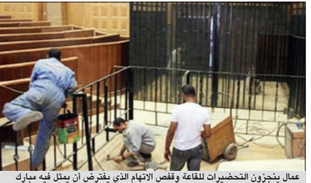
عمال ينجزون التحضيرات للقاعة وقصص الاتهام الذي يفرض أن يعمل فيه مبارك

القاهرة - وكالات: ساعات قليلة وتنتطق «محاكمة القرن» للرئيس السابق محمد حسني مبارك، حيث طلب النائب العام من وزارة الداخلية إحضاره للمثول أمام محكمة جنابات القاهرة للبدء بمحاكمته بتهم الفساد وقتل المظاهرين غدا. وقبما تقسم المصريون بين داعين للقصاص العادل، وآخرين داعين إلى الرأفة بالرئيس السابق لسته، تتجه الأنظار إلى مستشفى شرم الشيخ حيث يرقد مبارك، لمعرفة ما إذا كانت حالته الصحية تسمح بنقله إلى القاهرة ام لا. من جهته، أكد السفير السعودي في مصر أحمد عبدالعزيز قطان أن علاقة المملكة بمبارك انتهت منذ تنحيته عن السلطة في 11 فبراير الماضي، نافيا وجود أي ضغوط سعودية لمنع محاكمة مبارك. وكذلك نفى السفير ما نشرته بعض وسائل الإعلام عن تمويل الملكة للسلفيين بأربعة مليارات دولار. في غضون ذلك قامت قوات من الشرطة والجيش المصري أمس بغض اعتصام ميدان التحرير بالقوة واعتقلت عشرات الناشطاء. وذكر شهود عيان لوكالة الأنباء الألمانية (د.ب.أ) أن اشتباكات وقعت بين معتمدين وقوات الشرطة والجيش واستطاعت قوات من الشرطة العسكرية السيطرة على المحيط الخارجي للاعتصام واعتقال العشرات بينما تمكن عدد من الناشطاء من مغادرة الميدان خلال محاولات فض الاعتصام.