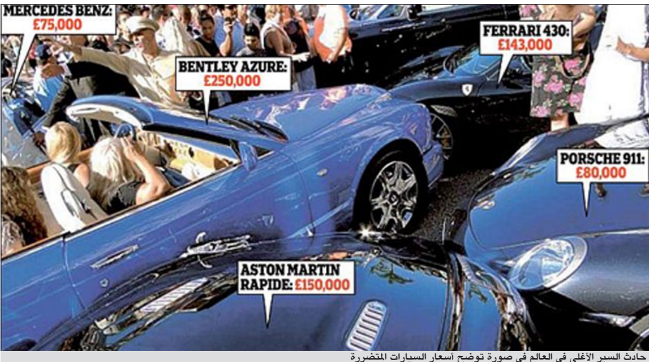
حادث السير الأعلى في العالم في صورة توضح أسعار السيارات المتضررة

السيارة عندما تجمع حولهن المارة والسياح ولم يستطعن الخروج من السيارة بسبب انحسار أبواب السيارة، وقدرت خسائر الحادثة بما يزيد عن 40 ألف جنيه إسترليني.