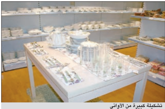
تشكيلة كبيرة من الاواني