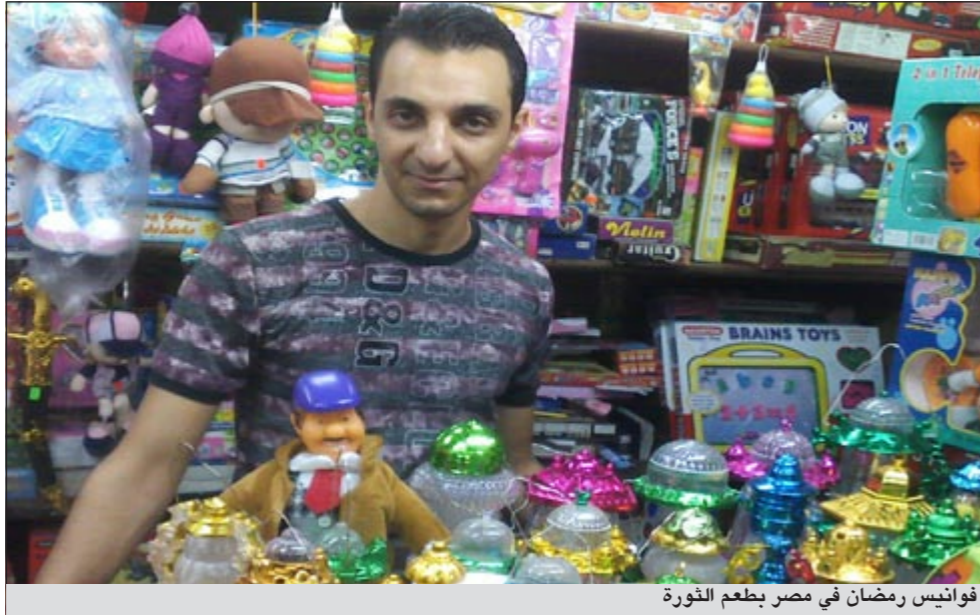
فوانيس رمضان في مصر بطعم الثورة

وأشار إلى أن الفوانيس المعروضة في السوق حالياً نوعان نوع صناعة صينية وأخرى صناعة مصرية، مبيناً أن الفوانيس المصرية منها كبيرة الحجم مثل فانوس «الحرمين»، وفانوس «ميرامار» ويفضل المصريون تعليق هذه الأنواع في الشوارع والشرفات نظراً لكبر حجمها.