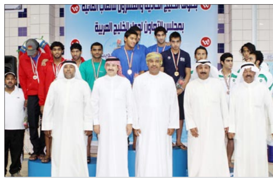
أبطال فئة «العمومي» في السباحة متوجين بالميداليات