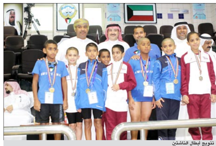
تتويج أبطال الناشئين

وشهد اليوم الاول لانطلاق منافسات السباحة لمرحلة البطولة الخليج الحادية والعشرين قبل الأخير لبطولة الخليج الحادية والعشرين للألعاب المائية بمجلس التعاون لدول الخليج العربية التي تستضيفها الكويت. ففي منافسات السباحة لمرحلة العمومي التي انطلقت أمس الاول فرض تماشح الكويت هيمنتهم بعد حصادهم لـ 13 ميدالية ملونة منها 7 ميداليات ذهبية و5 فضيات وواحدة برونز. وجاءت السعودية في المركز الثاني باثنتين ذهباً وواحدة فضة واثننتين برونزاً، والثالث الامارات بواحدة ذهباً وثلاث فضة وخمس برونزاً والرابع سلطنة عمان بفضية واحدة واثننتين برونزاً.