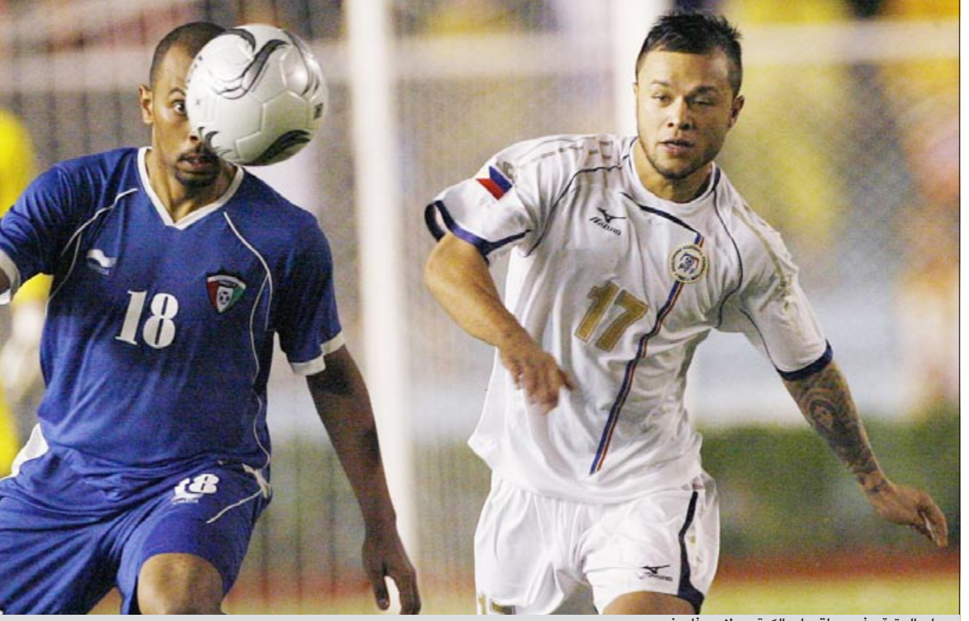
جراح العتيقي في سباق على الكرة مع لاعب فلبيني