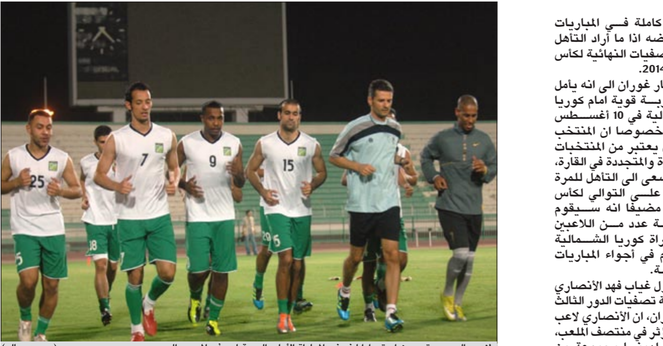
لاعبو العربي يتدربون استعدادا لخوض المباراة الأولى الودية لهم في الموسم الجديد (سعود سالم)

يخوض منتخبنا الأولمبي في الـ 7:30 مساء اليوم مباراته التجريبية الثانية أمام العربي على استاد صباح السالم حيث يستعد الأولمبي للمشاركة في البطولة الخليجية الثانية للمنتخبات الأولمبية المقرر انطلاقها في العاصمة القطرية الدوحة في الـ 12 من الشهر المقبل. وكان الأولمبي قد تعادل في تجربته الأولى أمام النصر 1-1 الأسبوع الفائت والتي شهدت مشاركة عدد من اللاعبين الذين تم استدعاؤهم مؤخراً لتدعيم صفوف المنتخب للمرحلة المقبلة