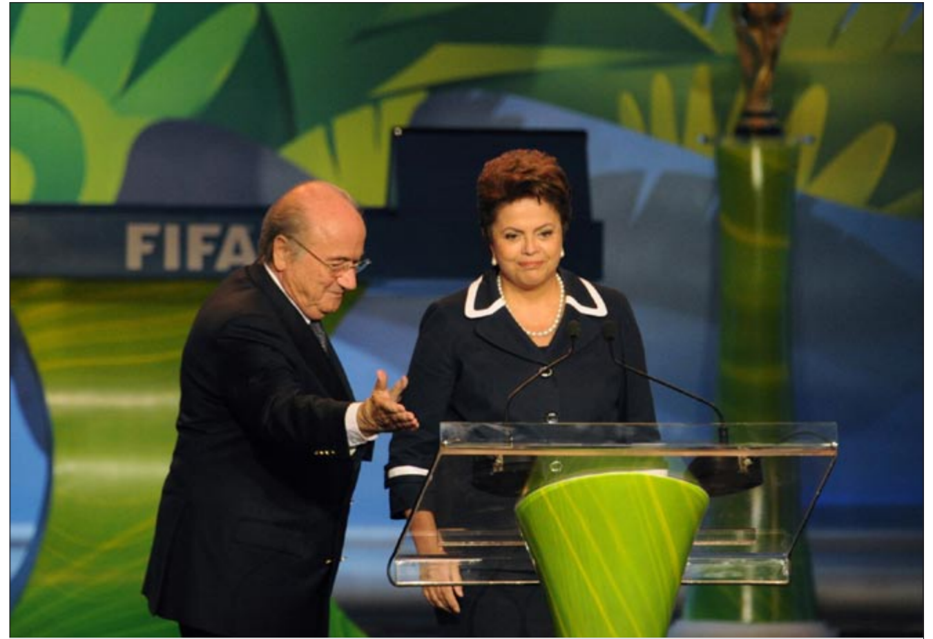
رئيس «فيفا» السويسري جوزيف بلاتر يترك الفرصة لرئيسة البرازيل ديلما روسيف للحديث قبل بدء مراسم القرعة

أوقعت قرعة تصفيات الدور الثالث لفسارة آسيا المؤهلة إلى مونديال البرازيل 2014 «الأزرق» في المجموعة الثانية المتوازنة التي جانب منتخبات كوريا الجنوبية والإمارات ولبنان. وتعتبر مجموعة «الأزرق» في المتناول لاسيما أنها أوقعت إلى جانب منتخبات بإمكان منتخبنا أن يتخطاها وهما الإمارات ولبنان، فيما ستكون العقبة الكبرى هي كوريا الجنوبية. وفي بقية المجموعات، جاءت منتخبات الصين والأردن والعراق وسنغافورة في المجموعة الأولى،