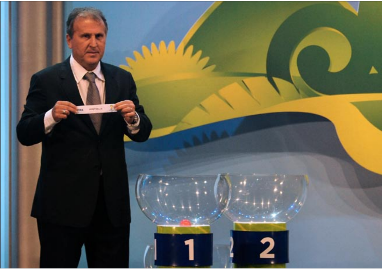
النجم البرازيلي السابق زيكو يعرض ورقة المنتخب الاسترالي