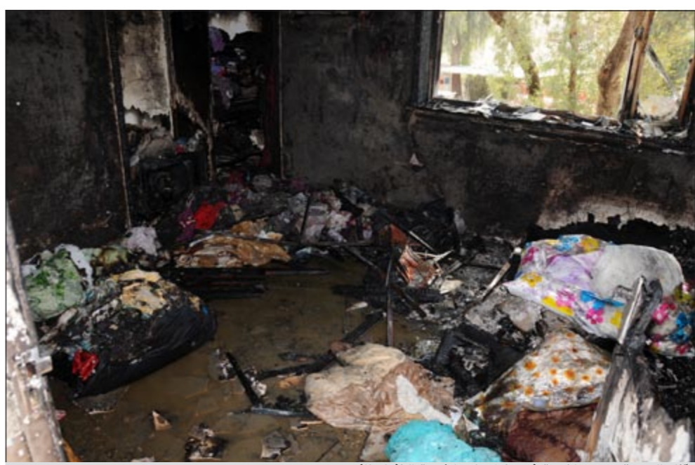
آثار الحريق تبدو واضحة في منزل تابع لشركة النفط بالاحمدي