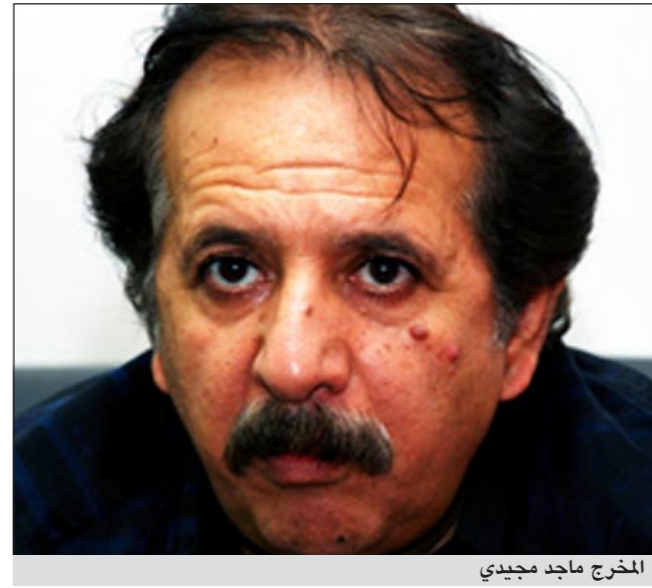
الخرج ماجد مجيدي

طهران - أم.بي.سي: أعلن سينمائيون إيرانيون عزمهم إنتاج فيلم جديد عن حياة الرسول محمد ﷺ، على أن يقوم أحد الممثلين الإيرانيين بتجسيد شخصية الرسول الكريم لأول مرة على الشاشة، وذلك في تحد جديد لمشاعر الملايين من المسلمين الذين يرفضون تجسيد نبي الإسلام في أي عمل درامي أو تسجيلي.