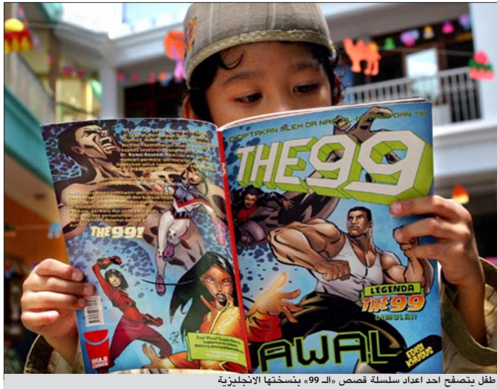
طفل يتصفح احد اعداد سلسلة قصص «الـ 99»، بنسختها الانجليزية

وبحلول مطلع العام المقبل، سيتم بث مسلسل تلفزيوني بالرسوم المتحركة على أساس فكاهي في أميركا الشمالية، والشرق الأوسط، وشمال أفريقيا، ومناطق في أوروبا وآسيا، وأخيراً في استراليا.