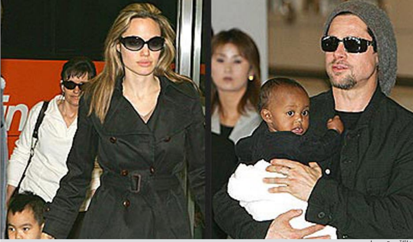
عائلة بيت وجولي

لندن - يو.بي.أي: قرر النجم براد بيت وأنجلينا جولي تفضية فصل الصيف مع أولادهما الستة في مقاطعة كورنوال الإنجليزية حيث يصور الممثل الأمريكي فيلمه الجديد في فالماوث. ونقلت صحيفة «السن» البريطانية عن مصدر لم تحدده إن «بيت فكر في أن تمضي عائلته إجازة (في كورنوال) فيما يصور فيلمه الجديد «الحرب العالمية زده»، وأضاف المصدر أن «كورنوال مختلفة عن الأماكن التي كانت العائلة تقصدها من قبل لكنهم سمعوا الكثير من الأمور الجيدة عن المقاطعة». وتابع إن «الإقامة على متن يخت تعني أنهم سيتمكنون من زيارة العديد من القرى المجاورة للبحر حتى لا يضجر الأولاد». وأشار إلى أنه بعد الانتهاء من تصوير المشاهد في كورنوال سيتوجه بيت في أغسطس إلى غلاسكو لتصوير مشاهد أخرى في الفيلم الذي تقدر تكلفته بأكثر من 130 مليون دولار.