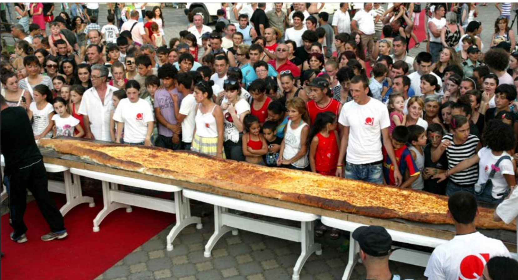
المئات امام الشطيرة قبل التهامها