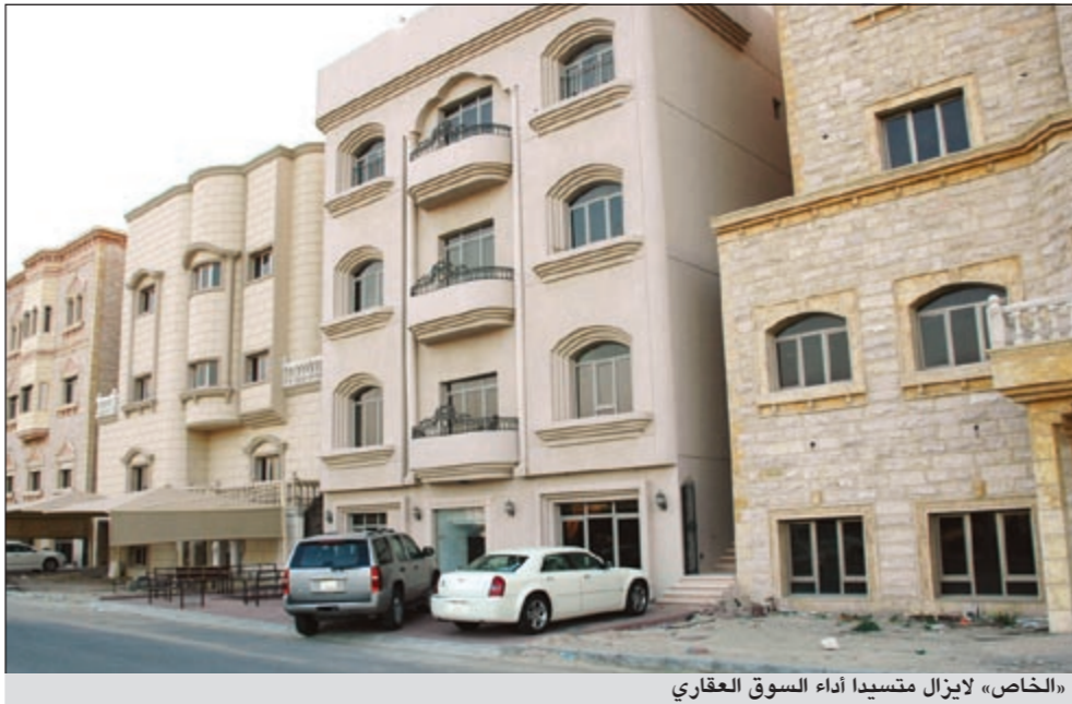
«الخاص» لإيصال متسيدا أداء السوق العقاري