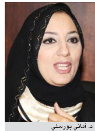
د. أماني بورسلي

وأيضا أن غياب المحفزات الإيجابية على السوق سوف تلقي بثقلها على أداء السوق العقاري في النصف الثاني رغم تحركات وزارة التجارة والصناعة الحديثة بقيادة وزيرة د.أماني بورسلي لتفعيل الأدوات المحركة للسوق العقاري ومنها المقاصة العقارية وإدارة العقار في وزارة التجارة والصناعة، مستدركين بان العقاريين يتجهون بانظارهم نحو الوزير عبد الوهاب الهارون لتنفيذ مشروعات خطة التنمية الاقتصادية والاجتماعية والتي يأمل الجميع منها تحريك العجلة الاقتصادية التي تعاني ركودا مزمن منذ فترة.