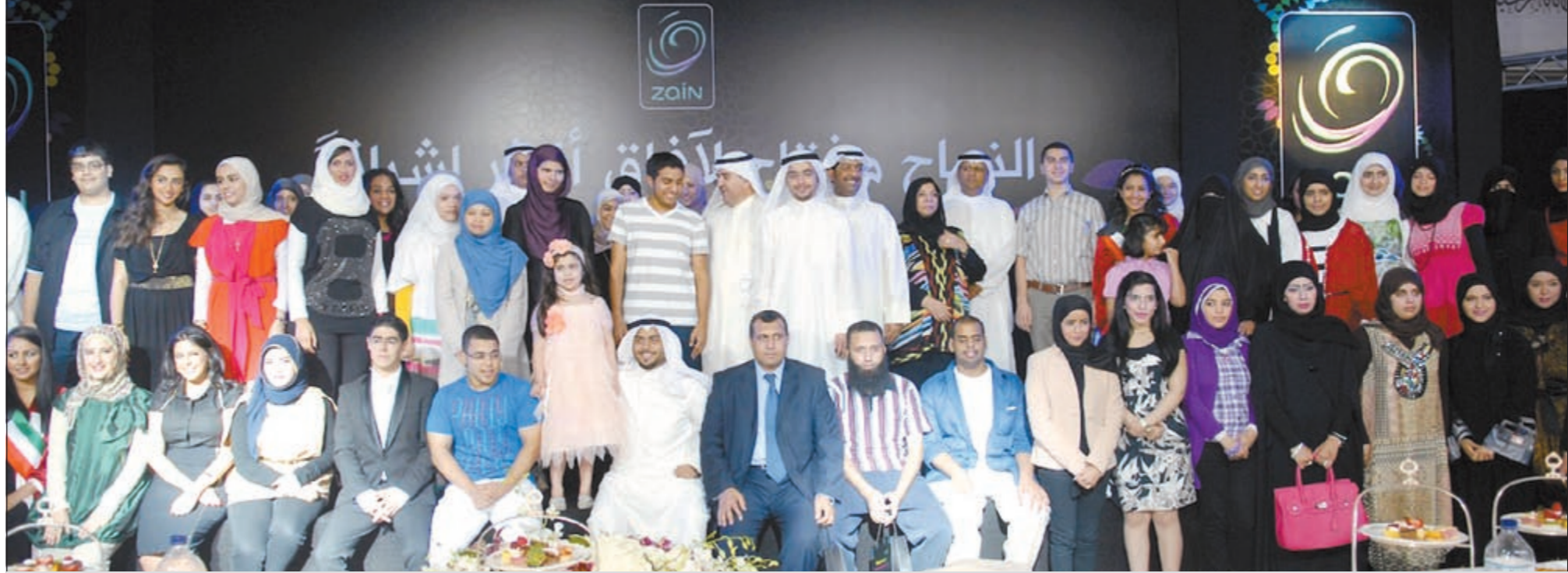
مسؤولو «زين» مع عدد من المتفوقين والمتفوقات