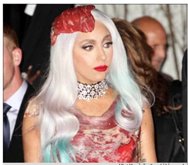
ليدي غاغا مرتدية فستان اللحم

الصن البريطانية اس ان نصوص الافلام بدأت تتدفق على الليدي غاغا خاصة بعد ان المحت قبل فترة إلى رغبتها في التمثيل.