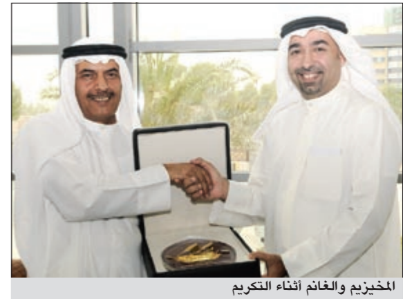
المخبرين والغائم أثناء التكريم

أشاد وكيل ديوان المحاسبة بالإبانة إسماعيل الغائم بجهود بيت التمويل الكويتي «بيتك» وحرصه على تعزيز روح التعاون مع هيئات ومؤسسات الدولة الرسمية والخاصة، مؤكداً في هذا الصدد أن هذه الجهود تتسجم كذلك مع الدور الذي يبذله «بيتك» في تعزيز دعائم الاقتصاد الوطني، باعتباره مؤسسة مالية عالمية ويمتلك تجربة ثرية ورصيدا من الإنجازات يؤهله لأداء هذا الدور. وقال الغائم في كلمة له خلال الحفل السنوي الذي ينظمه ديوان المحاسبة لوظيفية والذي شارك فيه «بيتك» للعام الثاني على التوالي، مشاركا «بيتك» الاجتماعية الناجمة من منطلقات شرعية وأخلاقية وإيمان بالمسؤولية، هي أيضا محل فخر للمجتمع الكويتي ومؤسساته.