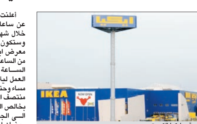
مقر «إيكا الكويت»

اعلنت ايكا مواعيد عملها الجديدة خلال شهر رمضان المبارك، وستكون ساعات العمل في معرض ايكا في الأقفوز من الساعة 10 صباحا وحتى الساعة 3 ظهرا. ويستم العمل ليل من الساعة 7,30 مساء وحتى الساعة 12,30 بعد منتصف الليل، وتقدمت ايكا بخالص التهنية والتبريكات الى الجميع بقدوم شهر رمضان المبارك.