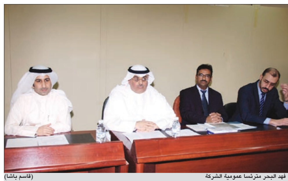
فهد البحر مترنسا عمومية الشركة (قاسم باشا)

وقد وافقت العمومية على جميع بنود جدول الأعمال التي من أهمها الموافقة على توصية مجلس الإدارة بعدم توزيع أرباح عن السنة المالية المنتهية في 31 ديسمبر 2010، كذلك الموافقة على شراء مجلس الإدارة 10٪ من أسهم الشركة طبقا لقانون الشركات، حيث تم تعيين مكتب البزيع للسنة المالية التي تنتهي في 31/12/2011 وتقويض مجلس الإدارة في تحديد أرباحهم.