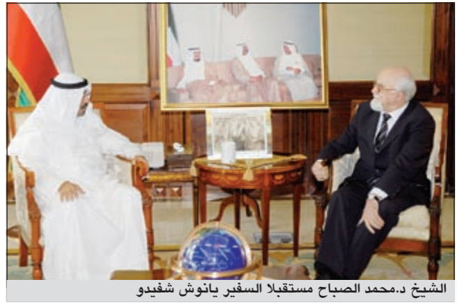
الشيخ د.محمد الصباح مستقبلا السفير يانوش شافيدو

استقبل نائب رئيس مجلس الوزراء ووزير الخارجية الشيخ د.محمد الصباح في وزارة الخارجية امس سفير جمهورية بولندا لدى الكويت يانوش شافيدو. وحضر اللقاء نائب مدير ادارة العلاقات المتعلقة بمشروع ميكنة خدمات التراخيص التجارية بالوزارة بهدف انجاز المشروع واطلاقه وفق الموعد المقترح في فبراير المقبل. وقالت الوزارة في بيان امس ان الوزارة بورسلي بحثت في اجتماع مع وكيل ديوان الخدمة المدنية محمد الرومي بحضور الفريق العامل في المشروع من قبل الوزارة اخصر تطورات هذا المشروع واهم العقبات التي تعرق مسيرته على الوجه المطلوب واهم الانجازات التي تحققت والمقترحات الخاصة بانجازها في الموعد المحدد. واضافت ان ديوان الخدمة قدم رؤيته حول ما قامت به وزارة التجارة في هذا المجال واهم النواقص المتعلقة بالمشروع وابرز ما يجب القيام به للمضي قدما حسب الفترة الزمنية المحددة.