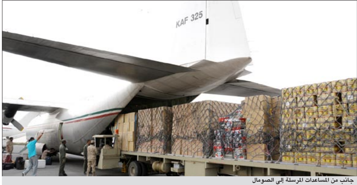
جانب من المساعدات المرسله إلى الصومال

انطلقت من قاعدة عبدالله المبارك الجوية تحمل على متنها مواد غذائية واغاثية إضافة الى الخيام وحليب الأطفال. واضاف ان ارسال هذه الطائرات المحملة بالمساعدات الإنسانية يأتي تنفيذاً لتوجيهات صاحب السمو الأمير الشيخ صباح الاحمد ونجسيدا لتضامن الشعب الكويتي مع الاشقاء في الصومال والحرص على الاسهام في تخفيف معاناة المنكوبين هناك. وذكر الزيد ان هذه الرحلة هي الثالثة لجمعية الهلال الأحمر ضمن الجسر الجوي بين الكويت والصومال على طائرات النقل التابعة للقوة الجوية الكويتية.