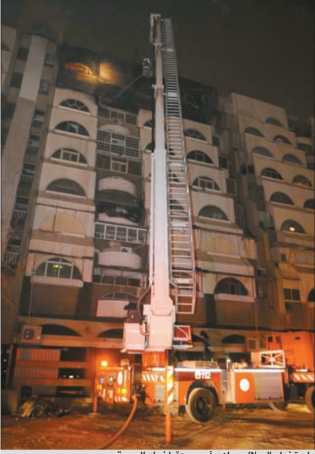
استخدام السلالم ساهم في سرعة إخماد الحريق