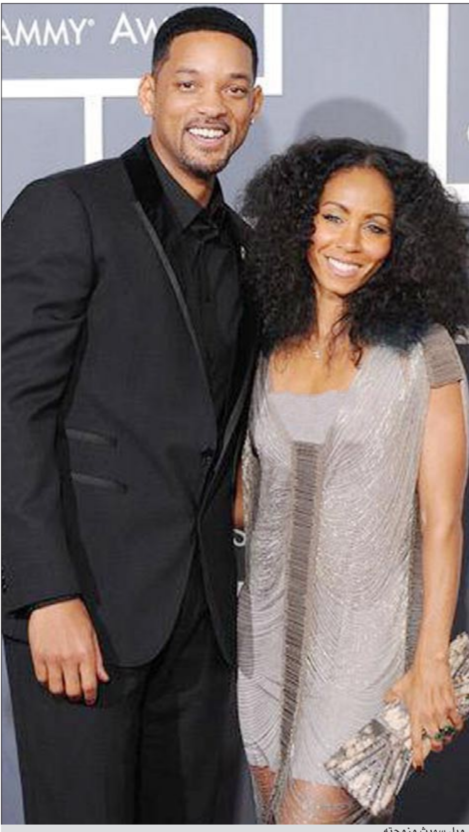
ويل سميث وزوجته