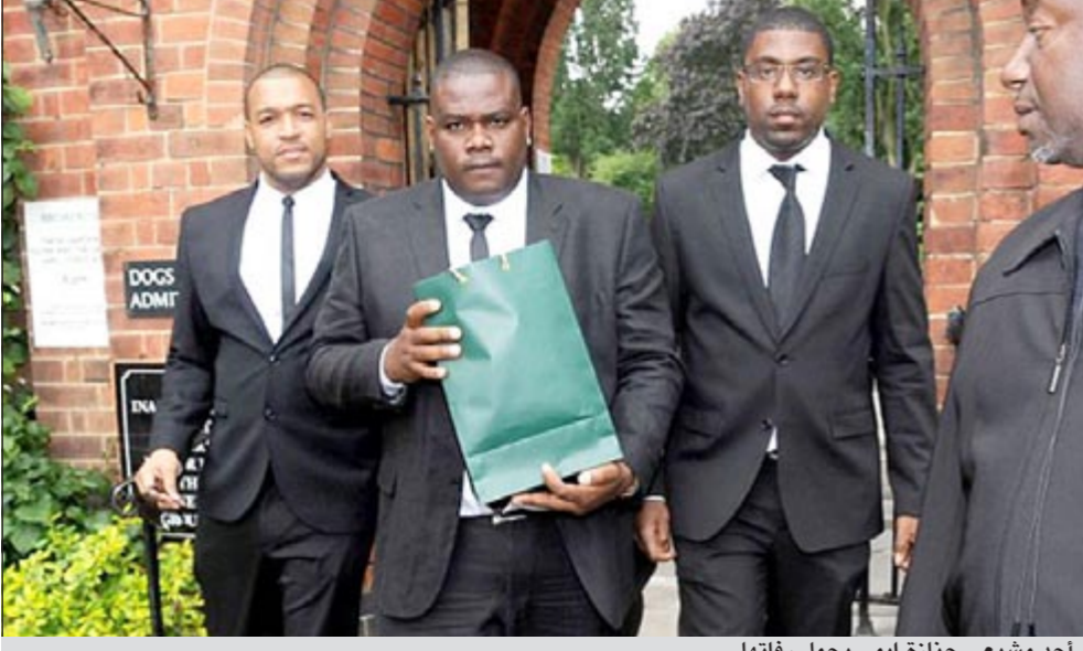
أحد مشيحي جنازة إيمي يحمل رفاتها