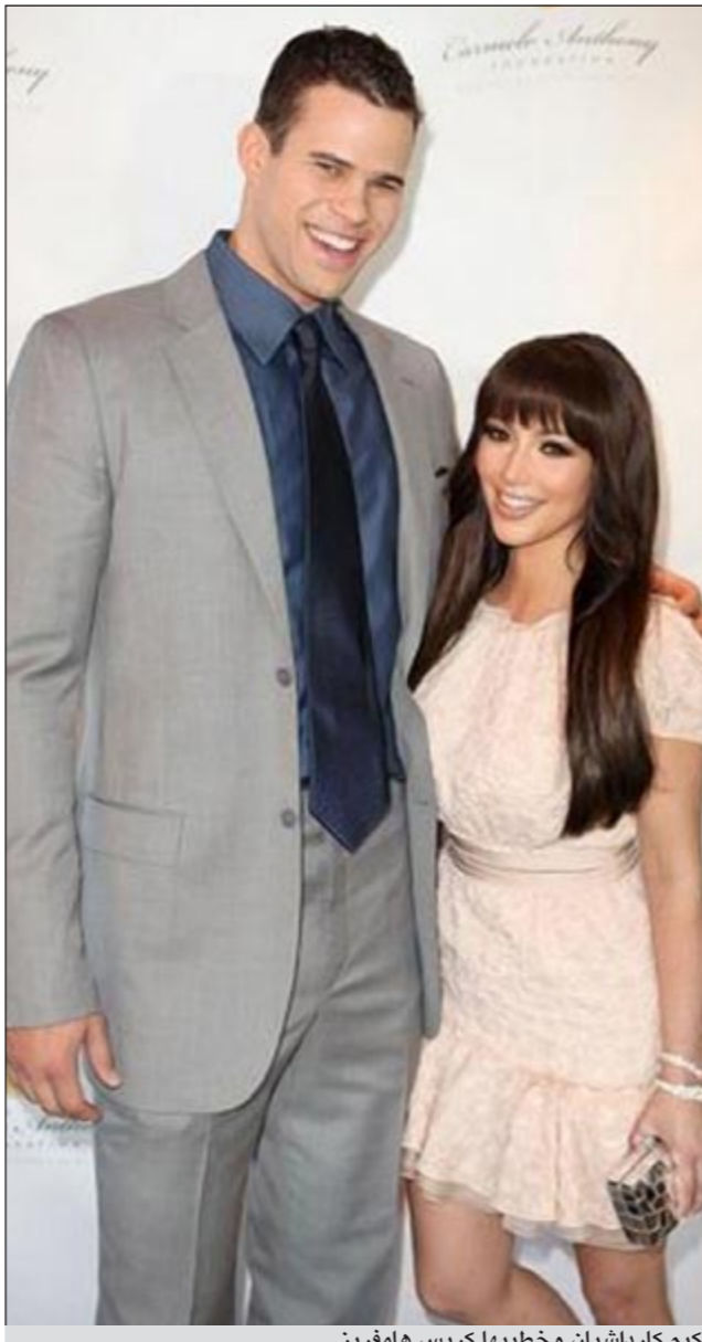
كيم كارداشيان وخطيبها كريس هامفرينز

وكالات: فرق الطول أمر عادي وطبيعي بين الأزواج، لكنه أحياناً ما يكون شاسعاً ولافتاً للنظر بشكل واضح وكبير وتكون المرأة هي الأطول كما في علاقة الممثل توم كروز وزوجته الممثلة كاتي هولمز ونيكول كيدمان التي تتميز بطولها الفارع والتي كانت زوجة توم كروز سابقاً وحالياً الموسيقي كيث أوريان. والفروقات في الطول تنتشر كثيراً في عالم عارضات الأزياء ولاعب كرة السلة كما يحدث مع كيم كارداشيان وخطيبها كريس هامفرينز.