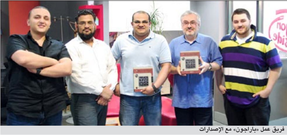
فريق عمل «باراجون» مع الإصدارات

أعلنت شركة باراجون الرائدة في مجال الاتصالات التسويقية في الكويت انه تم نشر أعمالها في كتاب التسويقية قد نشرت سابقاً في 18 كتاباً دولياً مثل More 1000 2010 Deign and Design Book of the Year The Best of Business Greetings لروكوبورت للنشر، و Card Design لسبيلي / بيتيت ديزاين / أوستن، و Letterhead & Logo Design 9 لدا سنان فرانسيسكو ديزاين أوفيس مايسن، و Logo Lounge 4 لبيل جاردر، و Identity Crisis لجيف فيشر، و The Big Book of Self and Crest Logos 3000 Master Library Initial & Mythology Shapes and Symbols, Typography, Arts and Culture and People, Nature and Food. وقد أعلنت باراجون مؤخراً عن افتتاحها مكتبها في عمان