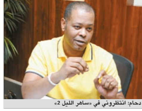
دحام: انتظروني في «ساهر الليل» 2

هناك مخرجون يتعمدون أن يوتروا الموجودين في اللوكيشن ما ينعكس على أداء الممثلين ويظهرون دون المستوى