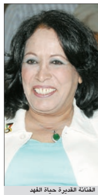
الفنانة القديرة حياة الفهد