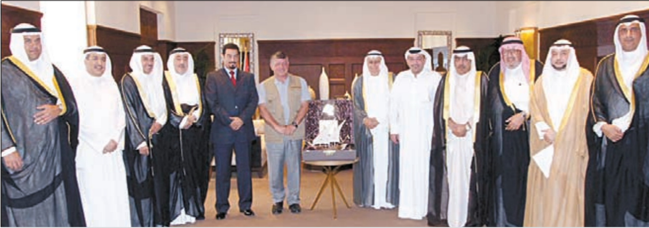
العاهل الأردني الملك عبدالله الثاني خلال لقائه الزملاء رئيس جمعية الصحافيين أحمد بيهاني ورئيس التحرير يوسف خالد المرزوق ونائب رئيس التحرير عدنان الراشد والوفد الصحافي الزائر بحضور السفير د. محمد الدعيع

أكد خلال لقائه الوفد الصحافي الكويتي أن بلاده ماضية في تحقيق الإصلاح الشامل العاهل الأردني: فرص كبيرة متاحة بين الكويت والأردن زيادة التعاون الاقتصادي والاستثماري