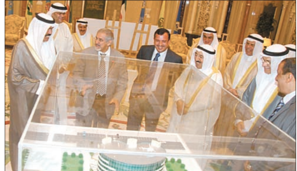
صاحب السمو الأمير الشيخ صباح الأحمد وسمو ولي العهد الشيخ نواف الأحمد يستمعان إلى شرح من د.هلال السايح عن مستشفى الكويت للكلية بحضور د. إبراهيم العبدالهادي وعبدالعزیز اسحاق

الأمر استمع إلى شرح عن مستشفى الكلي: الأرتقاء بالخدمات الطبية وتعزيز الخبرات الوطنية لخدمة المواطنين والمقيمين 09