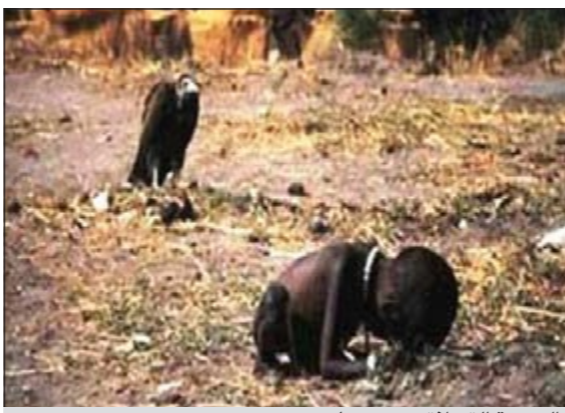
الصورة التي انتحر بسببها

انه التقط الصورة وقام بعدها بإبعاد النسر عن الطفلة. إلا أنه لم يسلم من الانتقادات اللاذعة التي وجهت إليه بسبب تجاهله وتقديم المساعدة إلى الطفلة الصغيرة. وبيعت الصورة لصحيفة «نيويورك تايمز»، حيث عرضت للمرة الأولى في 26 مارس 1993.