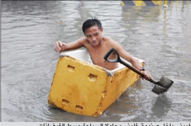
قلبيني داخل صندوق قلبيني محاولا السباحة وسط الفيضانات

مانايلا - د.ب.: قال مسؤولون إن تسعة أشخاص على الأقل لقوا حتفهم أمس جراء عاصفة استوائية تسببت في انهيارات أرضية وفيضانات عارمة في شرق الفلبين. وقال جوي سالسيد، حاكم إقليم الباي إن سبعة من الضحايا من سكان الإقليم الواقع على بعد 360 كيلومترا جنوب شرق مانايلا والذي تعرض لأمطار غزيرة ورياح عاتية ليلة أمس الأول بسبب العاصفة الاستوائية «نوك تن».