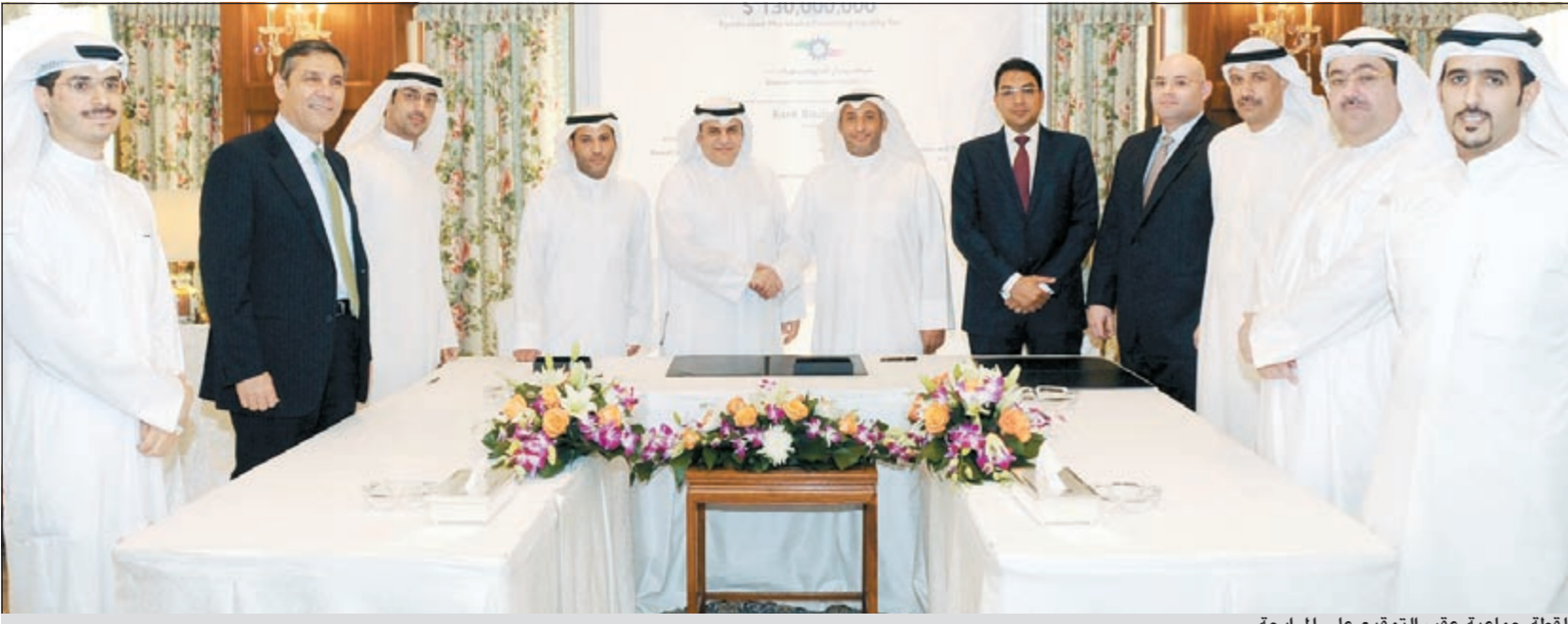
لقطة جماعية عقب التوقيع على المرابحة