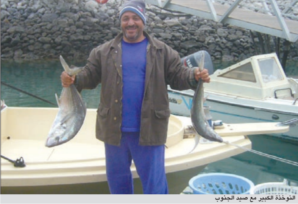
النوخذة الكبير مع صيد الجنوب