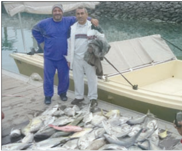
صيد الجنوب دائما متنوع