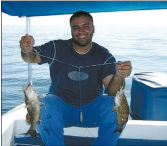
بواليل الجنوب شيء ثاني