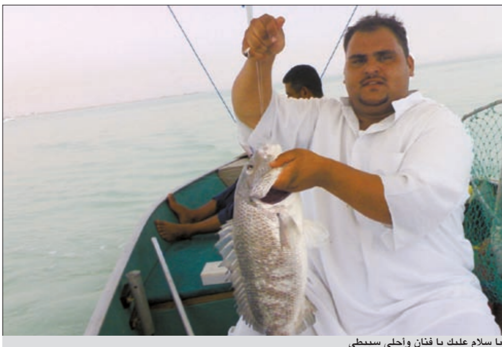
يا سلام عليك يا فتان واحلى سبيطي

ما السمكة المفضلة لديك؟ ● انا افضل اكثر شيء ثلاثة أنواع من الاسماك وهي السبيطي والشيم والشيم ولكن للأسف فقد قلت هذه الاسماك وقل صيدها وذلك بسبب التلوث والصيد الجائر وكثرة الحدائق.