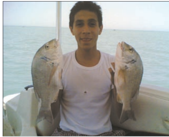
بصراحة خووش شعوم

دعوة تحب ان توجهها إلى من؟ ● اوجه دعوتي الى اخواني الحدائق وارجو منهم المحافظة على بحرنا الغالي وعدم رمي العلب والاكياس الفارغة به كما ادعوه الى الاهتمام بعودة السلامة والاسعافات الأولية كاملة دون نقصان كما اوجه دعوتي الى المسؤولين عن المسنات واقول لهم الى متى وانتم لا تستمعون الى شكاوى الحدائق والخاصة بقله المسنات وصيانتها الا تكفيكم كل تلك السنوات التي مضت وانتم تستمعون فقط دون ان تتحركوا وتجيدوا حلا لتلك المشاكل؟! وفي الختام ادعو للجميع بالصيد والسلامة.