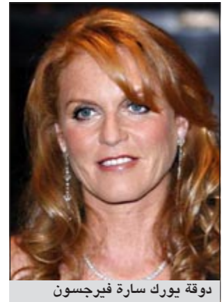
دوقة يورك سارة فيرجسون