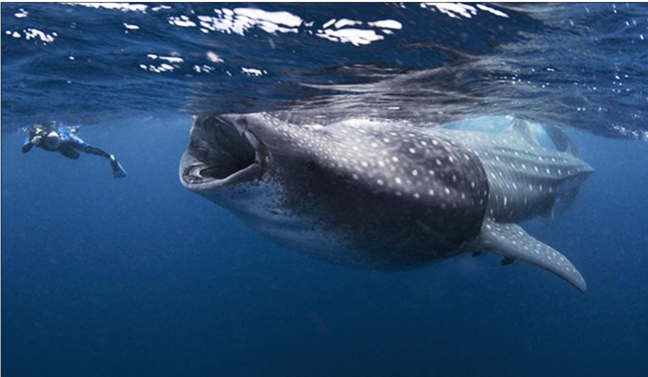
المصور يهرب من فم «الحوت»

أقدام، وحاول أن يبلع المصور بمعدراته، ولكن المصور استطاع الهرب والابتعاد عن الخطر الذي يمسح سببه القرش، وفي نفس الوقت استطاع زميله أن يلتقط صورة رائعة للمغامرة.