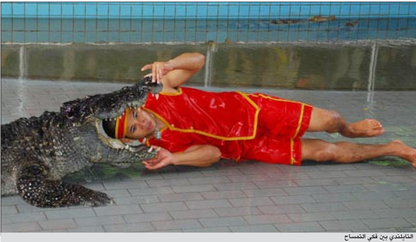
التايلندي بين فكي التمساح

يضع الرجال رؤوسهم في أفواهها ويقيمونها هناك لفترات طويلة، وتضم حديقة أكثر من 10 آلاف تمساح.