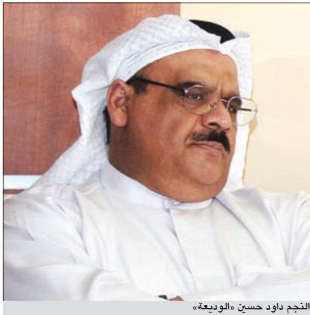
النجم داود حسين «الوديعة»