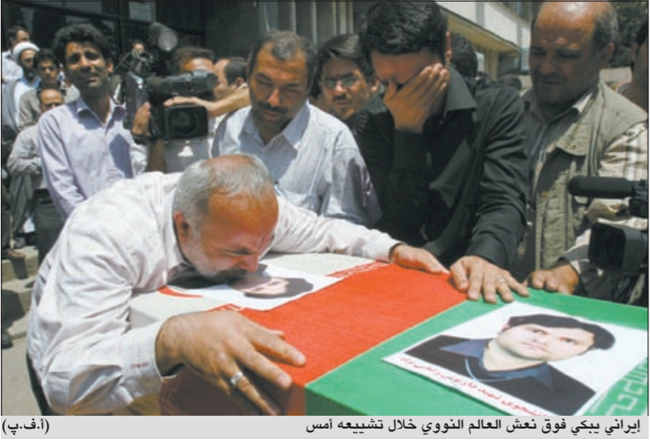
إيراني يبعث فوق نغش العالم النووي خلال تشييعه أمس

العلمية لغني إيران عن اكتمال درب التقدم.. وربط هذا الهجوم بذلك الذي أدى العام الماضي الى مقتل عالِمين فيزيائيين بارزين يعملان في البرنامج النووي الإيراني هما مجدي شهرياري ومسعود علي محمدي. وذكرت وكالة فارس أن حشود المشيعين كانت تهتف «الطاقة النووية حقنا المطلق». واعتبر رئيس مجلس الشورى علي لاريجاني من جانبه أن «هذا العمل الأميركي - الصهيوني ضد عالم في البلاد مؤشّر جديد على درجة عدوانية الولايات المتحدة» ضد إيران، مؤكداً أن «علي الأميركيين التفكير جيدا في عواقب مثل هذه الأفعال».