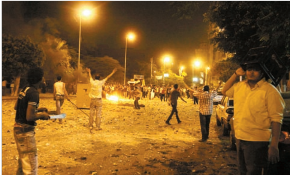
جانب من المواجهات التي حدثت في موقعة العباسية أمس الأول

وتذكر أباطة في تصريح صحفي أن الإصابات كانت ما بين جروح بالأسر وكدمات وجروح سطحية عميقة وإصابات ما بعد الارتجاج وثلاث حالات قصور ما زالت بالمستشفيات، وقد أكد التلفزيون المصري أمس عودة الهدوء إلى منطقة العباسية.