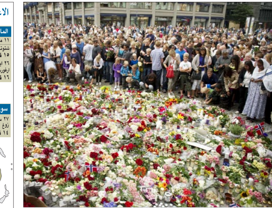
نرويجيون يضعون الورود في موقع انفجار القنبلة وسط أوصلو قبل أيام