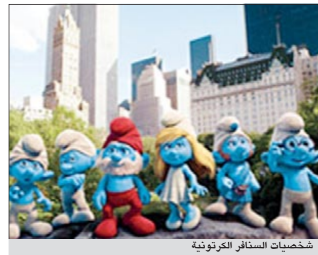
شخصيات السناقر الكرتونية

وسيناريو جيه ديفيد سنيغ، وديفيد إن ويس، وجيه شريك وهو مأخوذ من أعمال البلجيكي بيير كولفور، الذي ابتكر فكرة السناقر الحائرة على جائزة (إيمي).