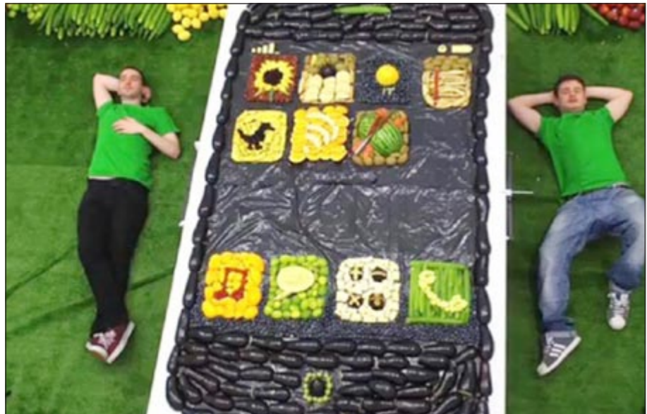
أي فون 5 عملاق.. مصنوع من الخضراوات

شكل نصائح غذائية وأنظمة صحية مفيدة من الفاكهة والخضراوات. من جهة أخرى، قامت «أبل» بالتخلي وبشكل صامت عن النسخة البيضاء البلاستيكية من جهاز «الماك بوك» الذي كان أحد أشهر أفراد عائلة «الماك»، ولكن جهاز «الماك بوك إير» والذي ظهر بعده أثبت أنه بديل ممتاز لهذا الجهاز بنحبه الشديد والمواصفات القوية. بالإضافة إلى السعر المقارب لجهاز «الماك بوك».