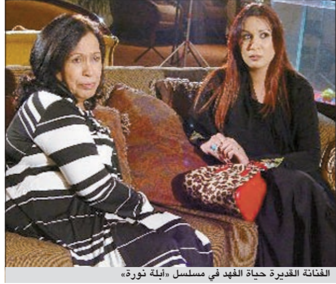
الفنانة القديرة حياة الفهد في مسلسل «أبله نورة»