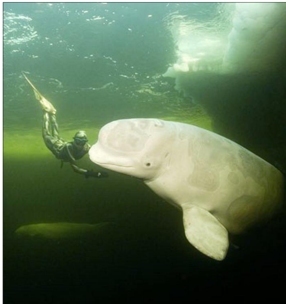
الروسية تحت الماء تداعب الدلفن

موسكو - وكالات: حققت الروسية ناتاليا أفسينكو الحائزة على بطولة العالم مرتين برياضة «فريدايفنج» (الغوص الحر بدون أنبوية أكسجين وحبس الأنفاس) إنجازا جديدا، إذ تمكنت من الغوص وحبس أنفاسها 12 دقيقة، وذلك في إطار الإعداد لتصوير فيلم وثائقي يحمل عنوان «السقف». وقد شارك بطلة العالم حوتان من فصيلة الحيتان البيضاء. وحول تجربة تصوير هذه اللقطات غير العادية قالت مخرجة الفيلم ناتاليا أوغليستكيخ لمراسل وكالة «ريا نوفوستي» للاثباء «لقد كانت لحظات استثنائية. فقد أصاب الارتباك الحوتين اللذين لم يعتادا على رؤية أجساد عارية، إذ تعودا على رؤية غواصين بلباس الغوص ومزودين بالمعدات اللازمة، بما فيها أنابيب الأكسجين». أما بطلة الحدث ناتاليا أفسينكو فقالت انها قامت بالإعداد للتصوير في ظروف مناخية قاسية، إذ انها بدأت تزاول مؤخرًا صقل قدراتها الجسدية والسباحة في مياه باردة وجو قارس، وذلك بعد أن أمضت 7 فصول شتاء متتالية في بلدان دافئة.