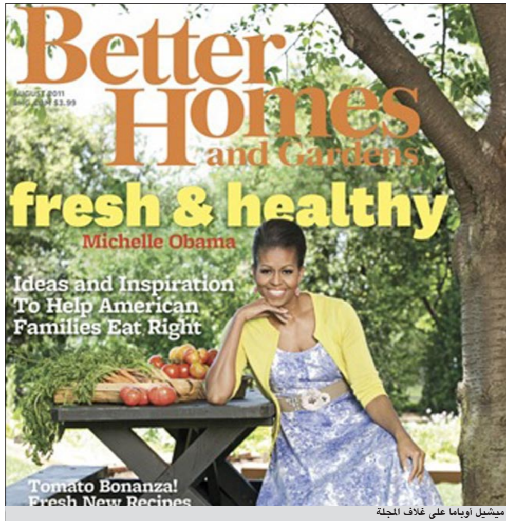
ميشيل أوباما على غلاف المجلة

واشنطن - يوبي.آي: شذت مجلة أميركية عن عادة عرض التصميم الداخلي للمنازل والحدائق على غلافاتها لتتصدر السيدة الأميركية الأولى ميشيل أوباما غلاف عددها لشهر أغسطس المقبل. وأفادت صحيفة «واشنطن بوست» الأميركية ان أوباما هي أول شخصية مشهورة تظهر على غلاف المجلة منذ العام 1963 يوم نشرت صورة الممثل كليف روبرتسون. وتظهر السيدة الأولى على الغلاف مبتسمة وترتدي ثوبا أبيض وأزرق وأصفر وهي تجلس الى طاولة مخصصة للنزهات مع عنوان هو «أفكار ميشيل أوباما النضرة والصحة وإلهام بمساعدة عائلات أميركا على الأكل بشكل صحيح». يشار إلى ان صورة أوباما نشرت في السنوات الثلاث الأخيرة على غلافات مجلات «بيبول» و«فوغ» و«إيوني» و«ليديز هوم» وغيرها. ويذكر ان أوباما تنشط في مبادرة لمكافحة بدانة الأطفال وتظهر استطلاعات الرأي انها أكثر شعبية من زوجها الرئيس الأميركي باراك أوباما.