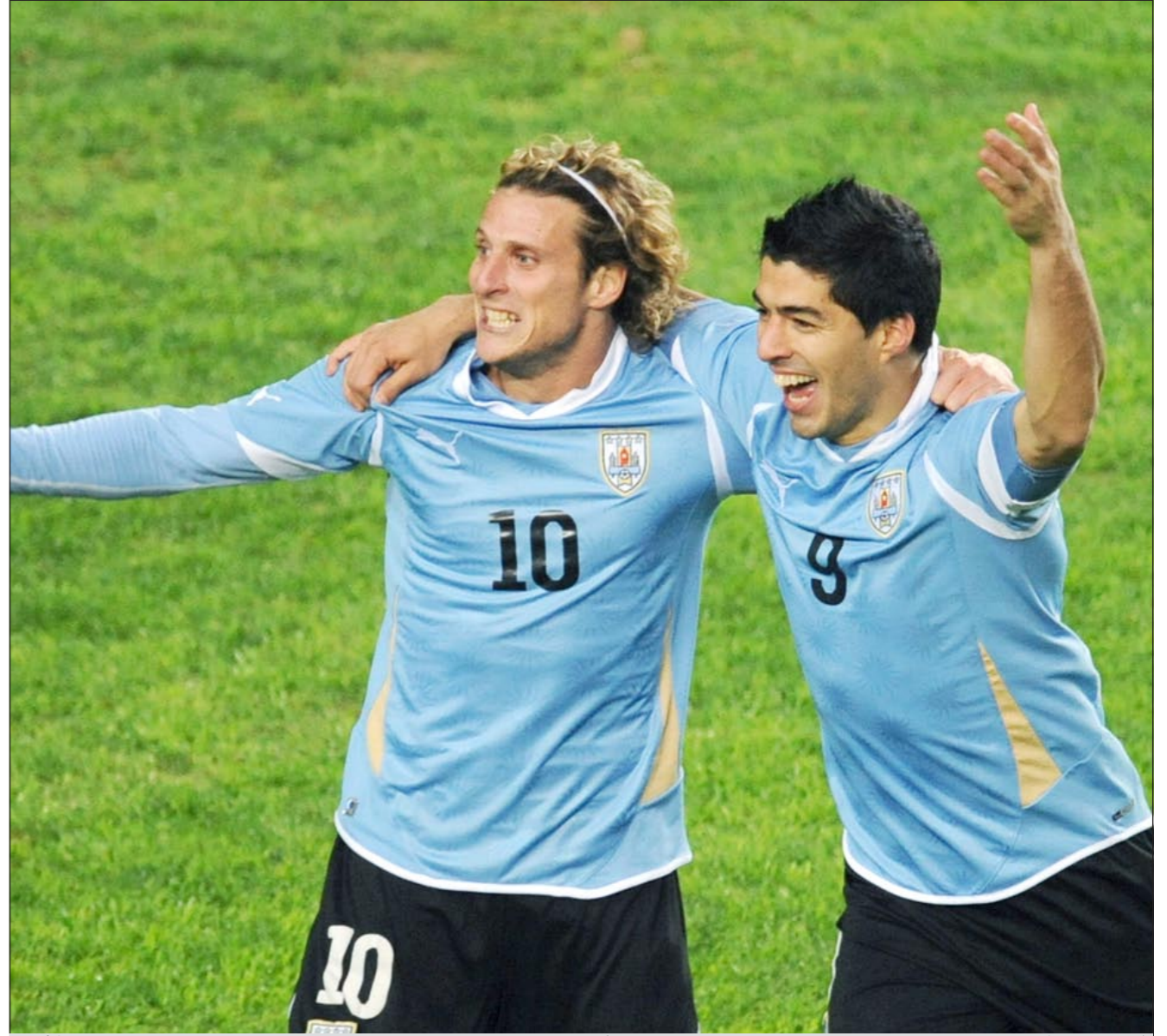
أمال جماهير أوروغواي معقودة على ثنائيتها المرعب لويس سواريز ودييغو فورلان

ويبقى الأوروغواياني هكتور كاسترو أفضل مسجل في المواجهات الثنائية، عندما سجل 4 أهداف خلال فوز فريقه 1-6 عام 1926. واللائق، أنه عندما احزرت باراغواي لقبها، التقت في كل مرة مع أوروغواي، فتعادلت معها 2-2 عام 1953، ثم مرتين بنتيجة 0-0 و2-2 في نهائيات 1979، وهذا ما يفتح الباب لتعادل جديد هذه المرة، قد يمنح باراغواي اللقب بركلات الترجيح بدون تحقيق الحكم البرازيلي سالفينو فاغونديس فلبليو (42 عاما) المباراة النهائية.