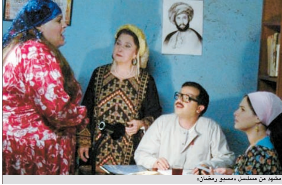
مشهد من مسلسل «مسيو رمضان»