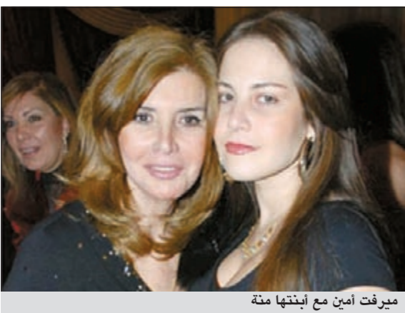
ميرفت أمين مع ابنتها منة

أغلقت ميرفت أمين هاتها الخليوي بعدما انهالت عليها اتصالات الصحافيين لمعرفة أسباب انفصال ابنتها منة حسين فهمي عن الممثل الشاب شريف رمزي، إذ رفضت الممثلة المعروفة الحديث في هذا الموضوع، بينما اكتفى شريف رمزي بإعلان الانفصال، مؤكدا في تصريح لموقع «أنا زهرة» «أن كل شيء قسمة ونصيب». وكان آخر ظهور لميرفت مع ابنتها خلال الغراء بوفاء دينا ابنة هاني شاكر. وقتها، انتشرت أقاويل عن وجود خلافات بين منة وزوجها، مما جعلها تحضر الغراء مع والدتها بعدما انتقلت للعيش معها تمهيدا للانفصال. ومن المعروف أن منة ثمرة زواج حسين فهمي وميرفت أمين، وكان الاثنان ارتبطا في منتصف التسعينيات ثم قدا مجموعة من الأفلام الشهيرة، لكنهما انفصلا في نهاية الثمانينيات.