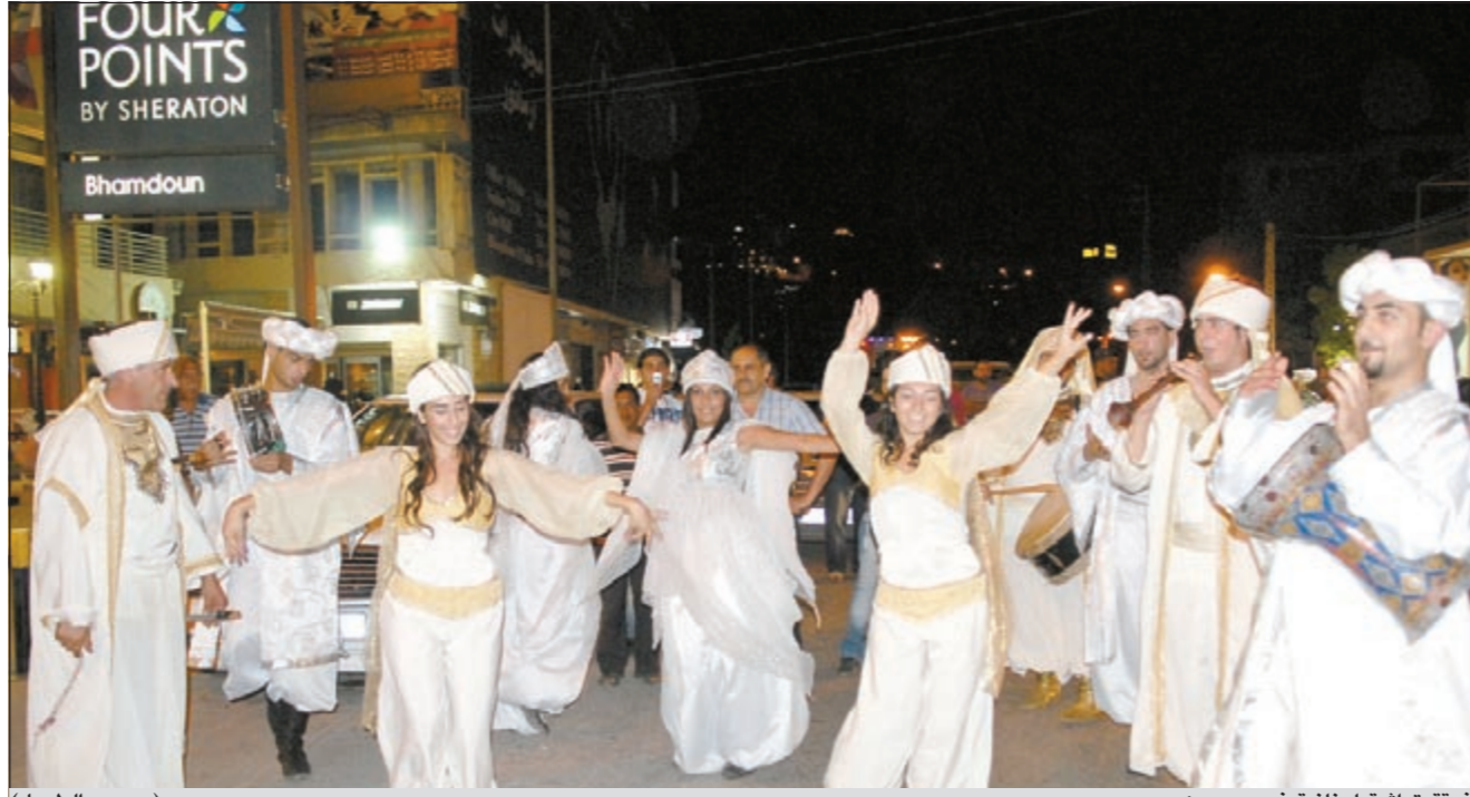
فرقة تراثية لبنانية في بحدون (محمود الطويل)

وكالات: أكدت كيم كارداشيان أنها تعاني من مرض جلدي «خطير»، وكشفت النجمة البالغة من العمر 30 عاماً، أنها مصابة بالصدفية وهو التهاب جلدي مزمن، يغير طبيعة الجلد ويؤدي إلى ظهور بقع حمراء أو زهرية في مختلف أجزاء الجسم. وكانت كريس جينير والدة كيم اكتشفت أيضاً إصابتها بهذا المرض منذ عقود. ومن المحتمل أن يكون وراثياً. وقالت كيم لجلة «ستابل ماغازين»: «سمعت بهذا المرض من قبل، لأن والدتي طالما عانت منه. لكنها لم تصب ببقع حمراء على كامل جسمها». وقد انتاب القلق كيم من أن يؤثر هذا المرض على مهنتها، خصوصاً أن الجمال مطلب أساسي في مجالها. لذا، فهي تشعر اليوم بضغط أكبر فيما يخص جمالها وتحقيقها المستوى الأمثل من الكمال. وأضافت نجمة تلفزيون الواقع: «لا يفهم الناس الضغط الذي أعيشه بغية أن أبدو كاملة. حين أزداد وزناً، أرى أن الخبر يتصدر المحلات والصحف. لذا، تخيلوا ماذا سيفعلون بي لو رأوا هذه البقع على جسمي».