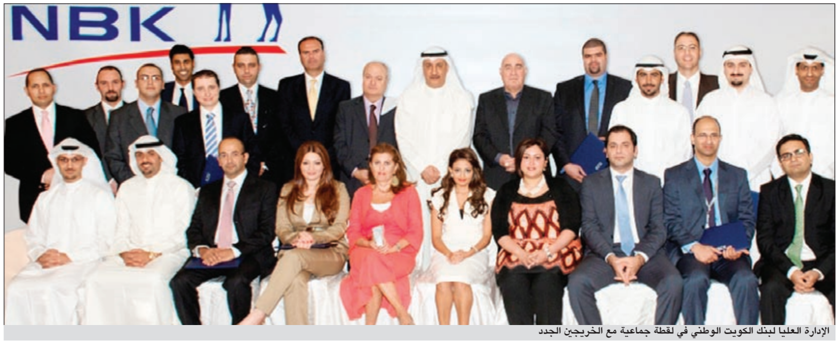
الإدارة العليا للبنك الكويت الوطني في لقطة جماعية مع الخريجين الجدد