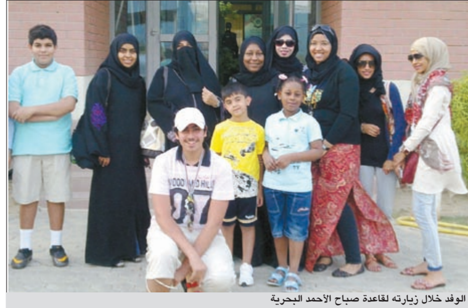
الوفد خلال زيارته لقاعدة صباح الأحمد البحرية

في القبض على المهريين من خارج البلاد، وكميات الخمور والمخدرات التي تم القاء القبض على أصحابها، وكيفية القبض عليهم، إلى جانب عرض قدمه أحد الغواصين للتعريف بمهارة الغوص وأدواته وأجهزته، فيما اختتمت الزيارة بجولة للتعرف على البحوث والسفن البحرية الموجودة في القاعدة.