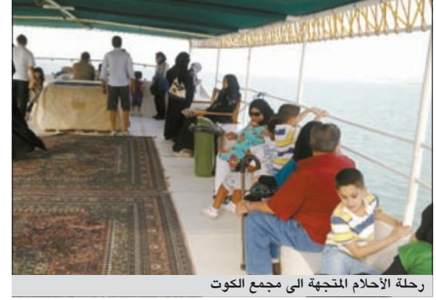
رحلة الأحلام المتجهة إلى مجمع الكوت